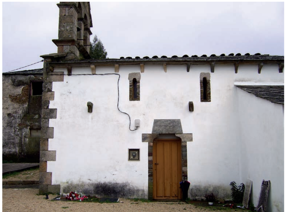
Fachada sur de la nave

En el interior, bajo la cubierta de madera a dos aguas sobre tirantes de la nave, aportan luz dos aspilleras por cada uno de los muros laterales en las que se utiliza el granito para