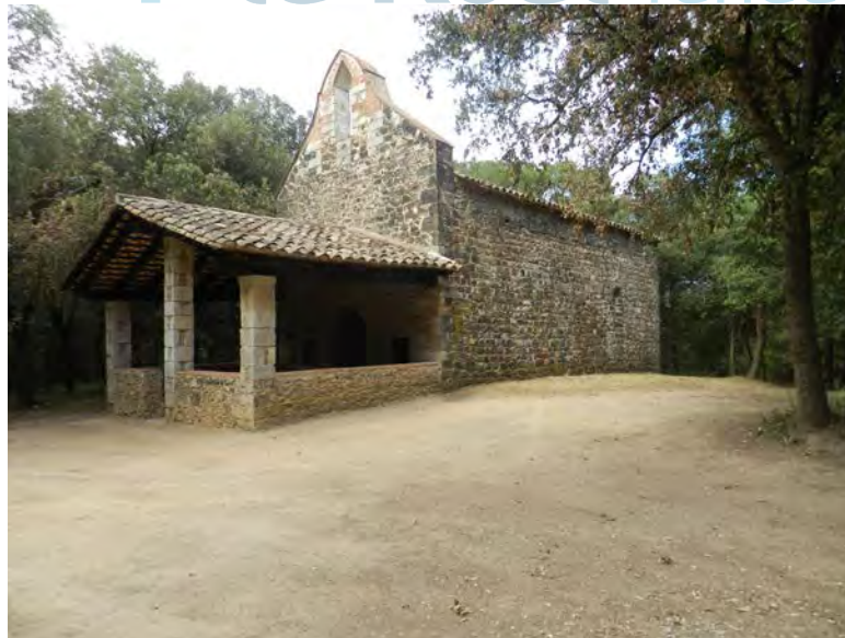
Vista desde el lado suroeste

Aunque presumiblemente se trata de un templo de mayor antigüedad, la primera noticia documental que se conoce de la iglesia es del 1290, cuando recibe un legado de unos libros.