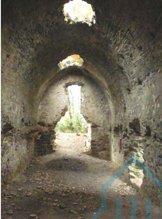
Vista interior hacía el Oeste

Se trata de una iglesia de una sola nave, cubierta por bóveda de cañón ligeramente apuntada, y con un ábside semicircular. En su interior se pueden apreciar, en la bóveda, todavía restos del cañizo de la cimbra, y lo mismo en un nicho que hay abierto en el en el muro septentrional. En la parte central del ábside se abre una ventana de arco de medio punto con doble derrame. Los muros exteriores están acabados en forma de talud, y construidos con un aparejo de sillares irregulares de piedra volcánica local, colocados en hiladas horizontales.