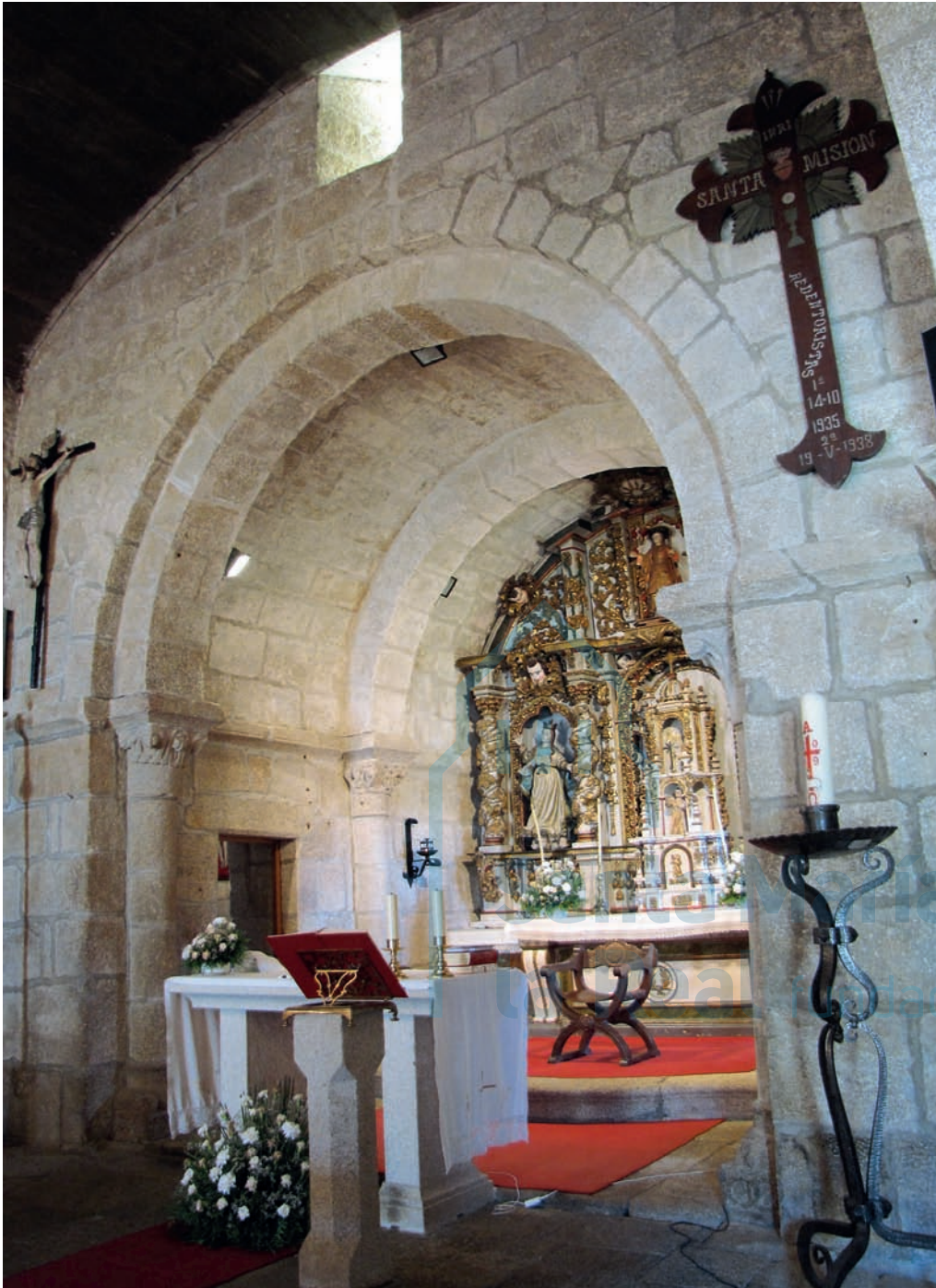
Interior de la cabecera

mo tramo de la capilla mayor más elevado. La basa de la derecha tiene un filete que recorre, en el punto medio, la escocia y el toro inferior.