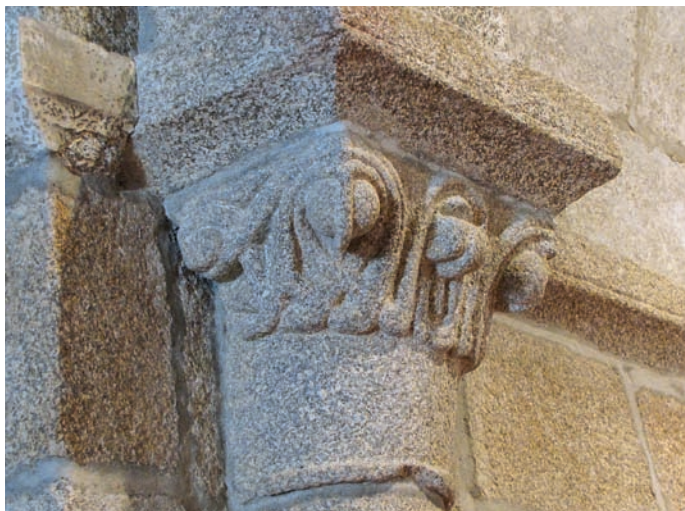
Capitel del arco triunfal