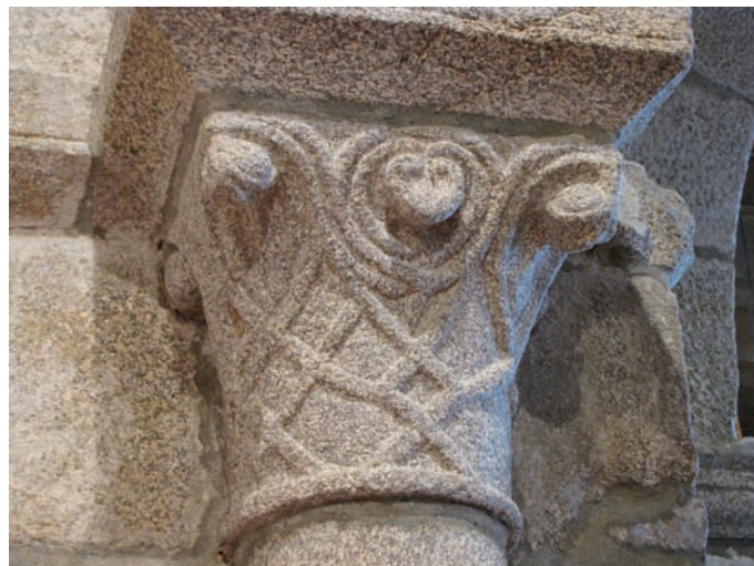
Capitel del arco triunfal