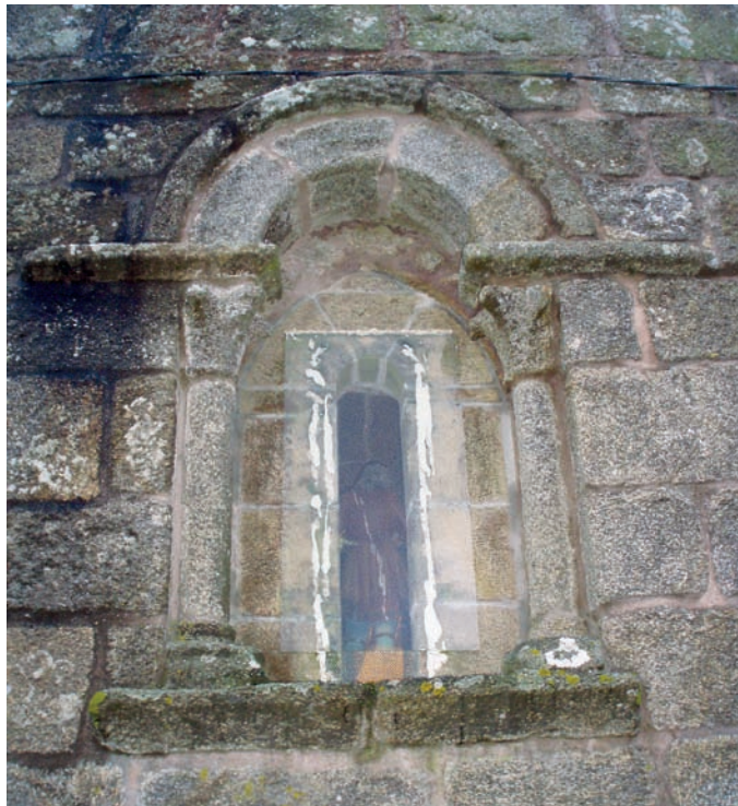
Ventana del testero

SORALUCE BLOND, J. R. y FERNÁNDEZ FERNÁNDEZ, X. (dirs.), 1995-2010j, X, p. 84.