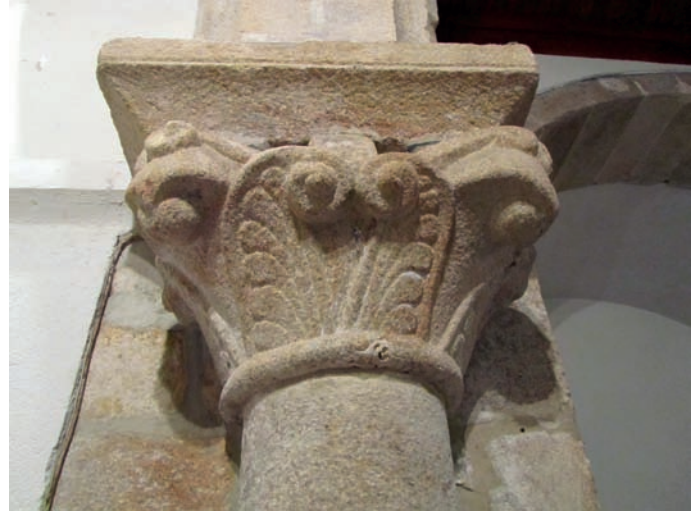
Capitel del arco triunfal

San Pedro de Busto presenta un tipo de capitel deudor de los talleres que trabajaban en los brazos del transepto y