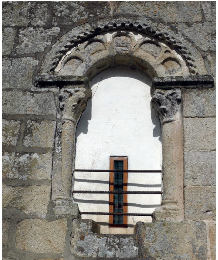
Ventana de la cabecera