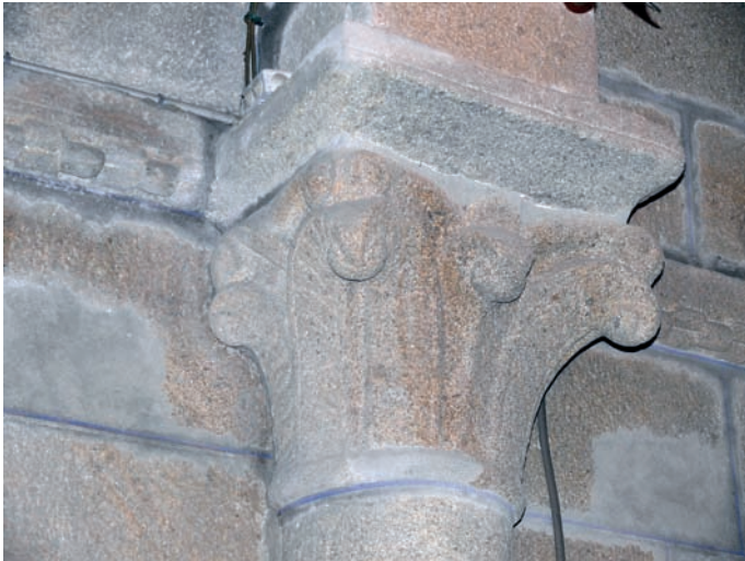
Capitel de la cabecera

A pesar de lo parcial de los restos medievales conservados, nos encontramos en Caamaño con una serie de elementos que resultan de especial interés. La profusión ornamental que se evidencia en las basas de las columnas del presbiterio, así como en la credencia abierta en el muro sur y en la imposta abilletada, encuentra su correspondencia en el exterior del edificio en la decoración de la arquivolta de la ventana del testero. Nos encontramos ante soluciones de influencia compostelana que existen en otros templos, como San Xoán de Vilanova o San Cristovo