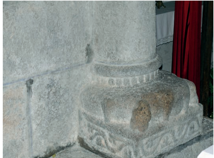
Basa de la cabecera

A pesar de lo parcial de los restos medievales conservados, nos encontramos en Caamaño con una serie de elementos que resultan de especial interés. La profusión ornamental que se evidencia en las basas de las columnas del presbiterio, así como en la credencia abierta en el muro sur y en la imposta abilletada, encuentra su correspondencia en el exterior del edificio en la decoración de la arquivolta de la ventana del testero. Nos encontramos ante soluciones de influencia compostelana que existen en otros templos, como San Xoán de Vilanova o San Cristovo