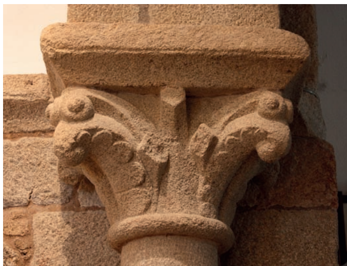
Capitel del arco triunfal