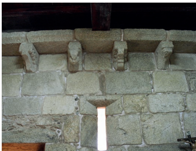
Canecillos del muro sur de la cabecera