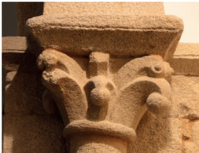
Capitel del arco triunfal