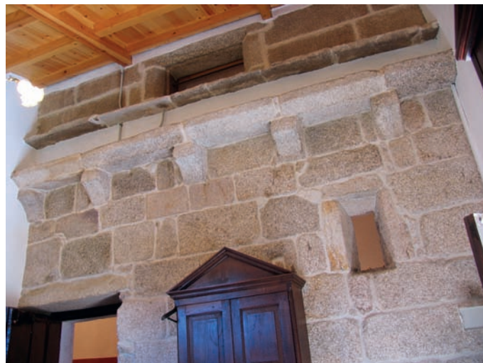
Cornisa de la cabecera vista desde la sacristía

CARDES LIÑARES, J., 1993, pp. 27-42, 313, 316 y 481; CARRÉ ALDAO, E., s. a., II, p. 756; CARRILLO LISTA, M. P., 2005, pp. 350-352; LÓPEZ FERREIRO, A., 1901a, p. 86; SORALUCE BLOND, J. R. y FERNÁNDEZ FERNÁNDEZ, X. (dirs.), 1995-2010a, I, p. 188.