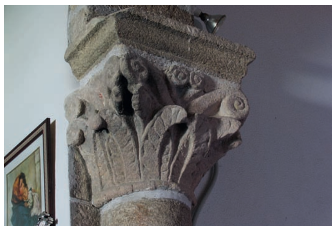
Capitel del arco triunfal