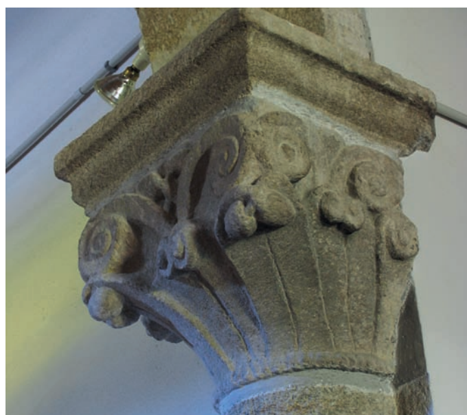
Capitel del arco triunfal