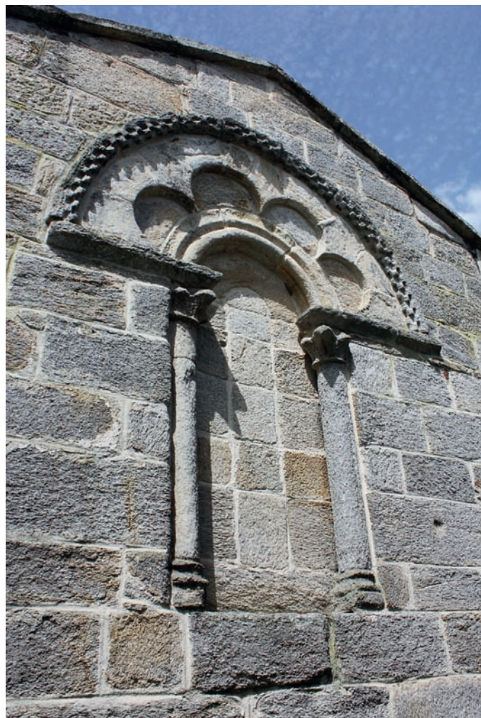
Ventana del ábside

Mateo. Aunque la fuente última de la ventana de Tallo sean los talleres compostelanos de época gelmiriana, creemos que su autor pudo ser un maestro vinculado al cercano