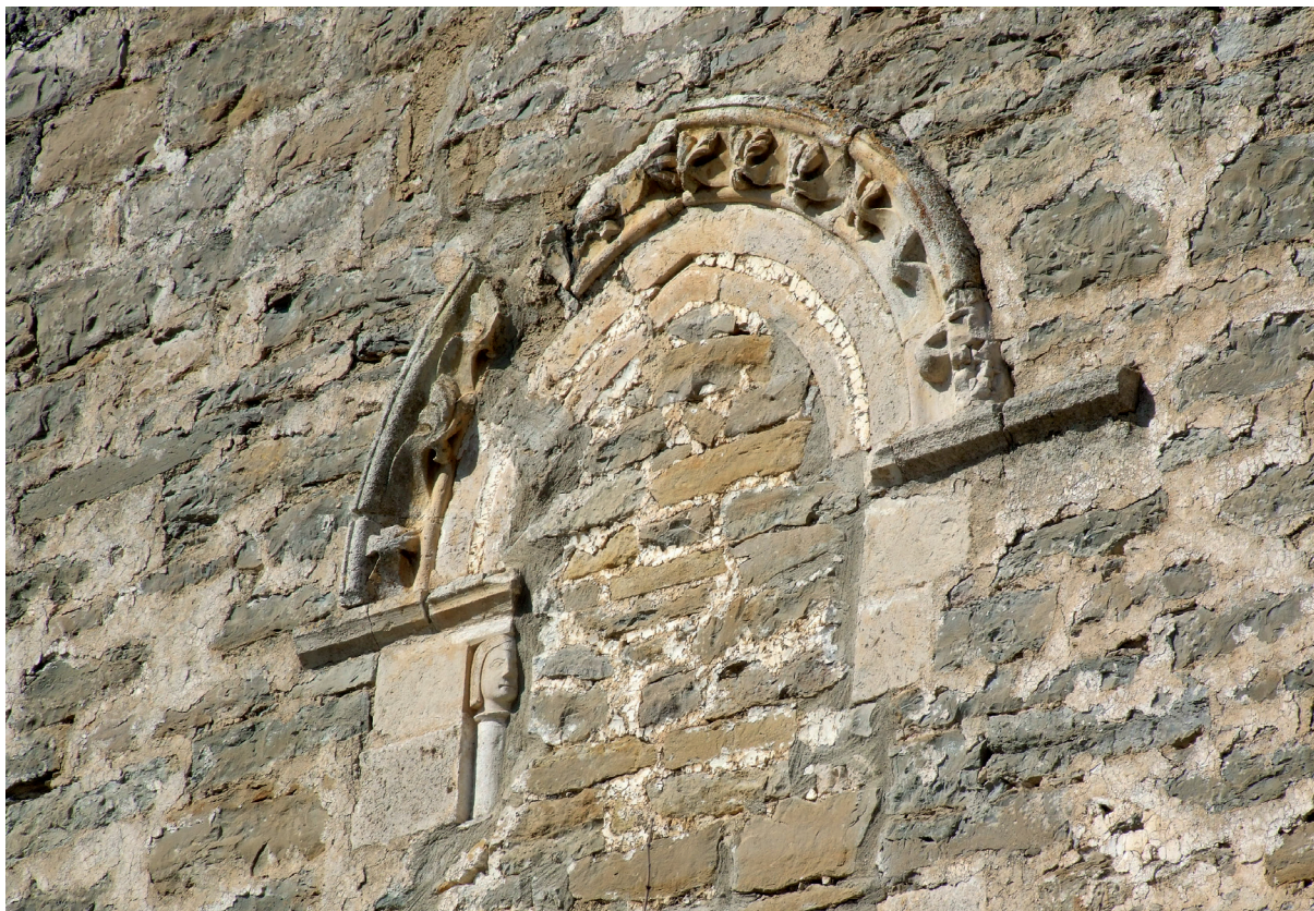
Burualdearen ekialdeko leihoa