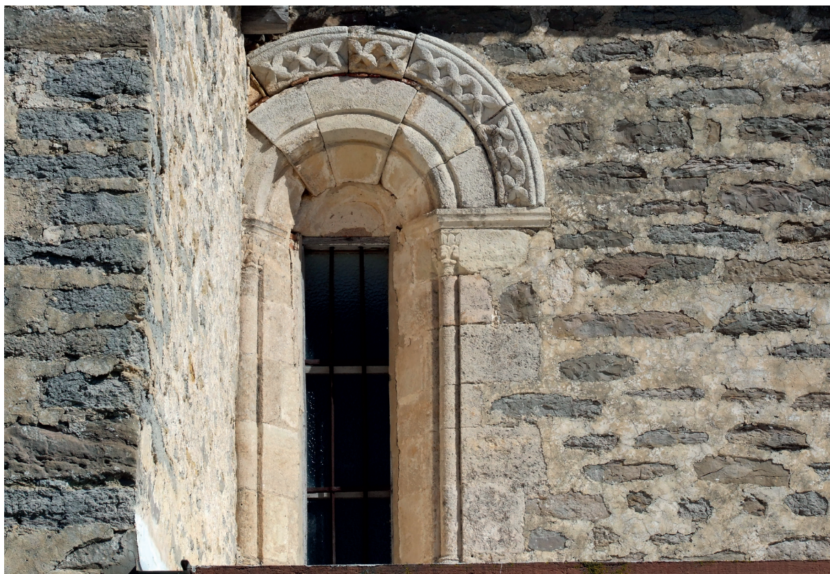
Burualdearen begoaldeko leihoa