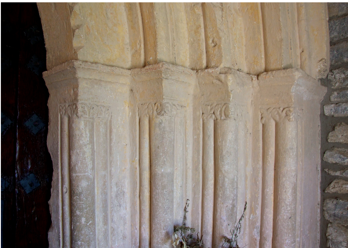
Portadako xebetazuna Detalle de la portada