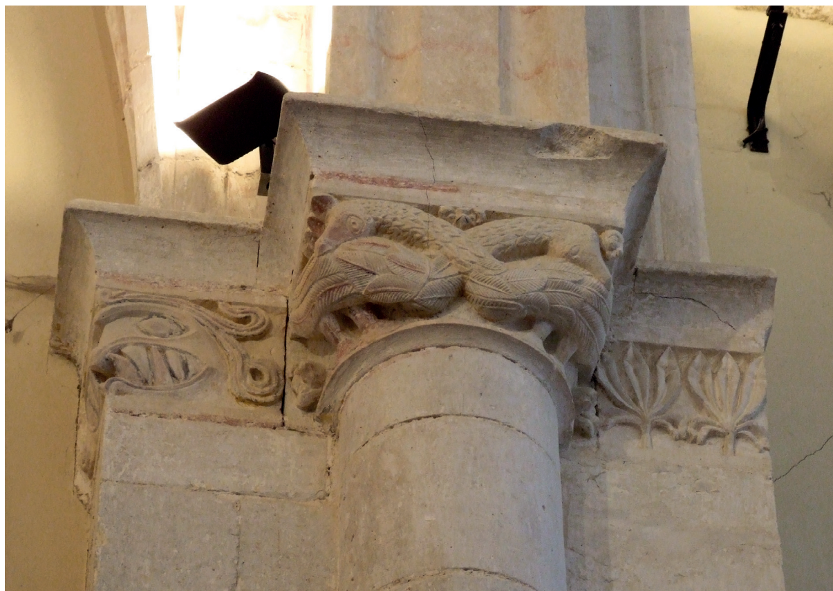
Garaipen-arkuko eskuineko kapitela