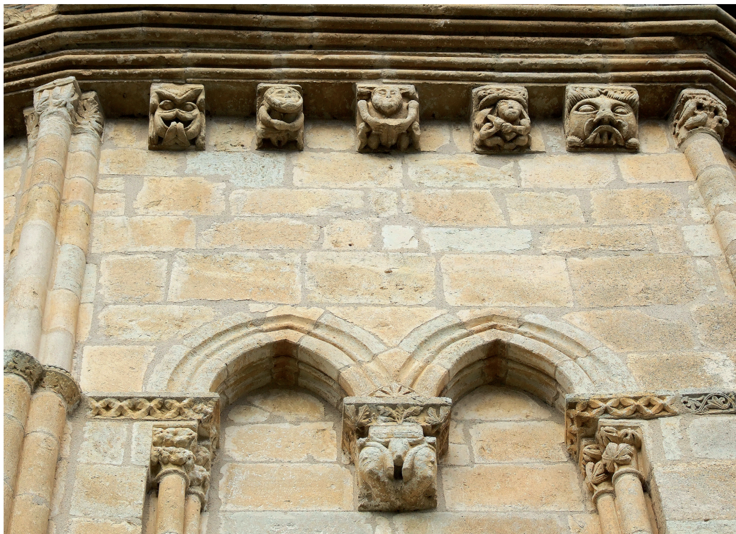
Burualdeko xebetazuna / Detalle de la cabecera

Bigarren atalean, berriz, lau harburu daude: txanodun bikote bat, elkarri bizkarra ematen; bi pertsona zutabe baten alde bietan, elkarri hurbilduz eta eskua emanez; muntro baten burua, ahotzarra zabalik; eta buru irribarretsu bat. Hirugarren atalean, oster, lau harburu: hortz handiko buru bat, hondatua; zezen baten burua, eder eta estilizatu, eta beste bi, landare-bolutekin. Laugarren atalean, txanodun bola dauka harburu batek; bolak gainean bolutak dituztela; palmeta estilizatuak; kapitel forma duen mentsula bat, landareen apaindura eta erliebearekin. Bosgarren atala, lehen esan dugunez, sakristiak ezkutatuta dago.