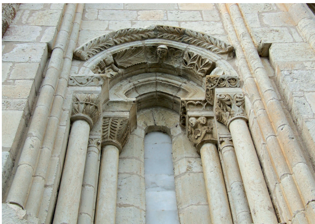
Burualdeko leibo nagusia