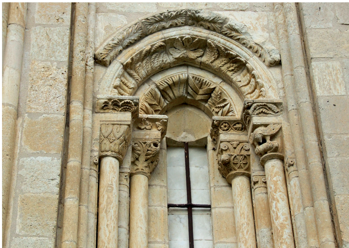
Burualdearen alboko leiboa