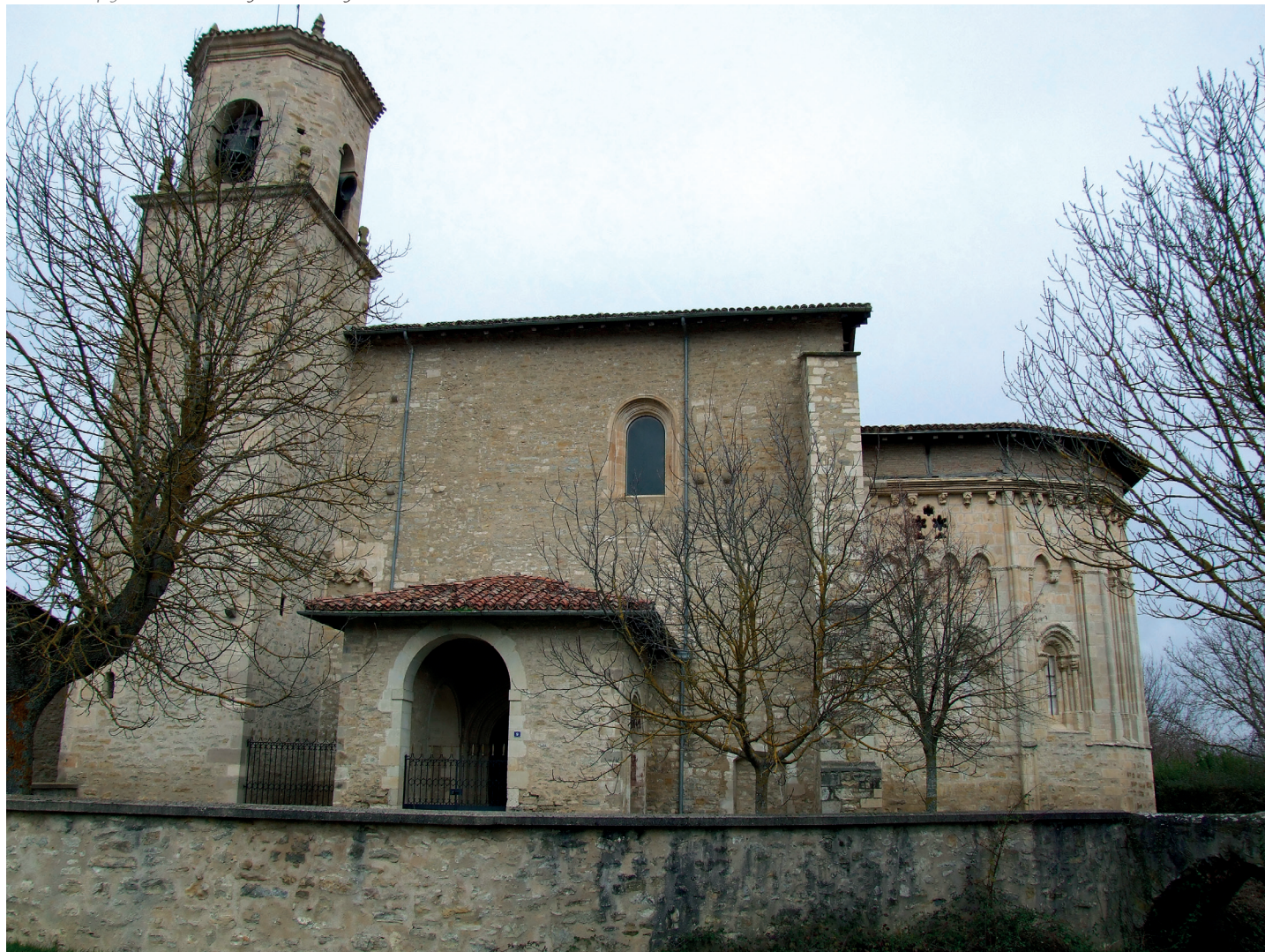
Elizaren ikuspegi orokorra / Vista general de la iglesia

En la cabecera se abren tres ventanas, una en el muro del presbiterio y las otras dos en los paños primero y tercero. Las tres presentan arcos apuntados, dos arquivoltas y sobreacto, con dos pares de columnas a cada lado. La decoración de las arquivoltas es muy estilizada, ya muy próxima al gótico, con elementos vegetales y naturalistas, pero hay motivos que aún mantienen la tradición románi-