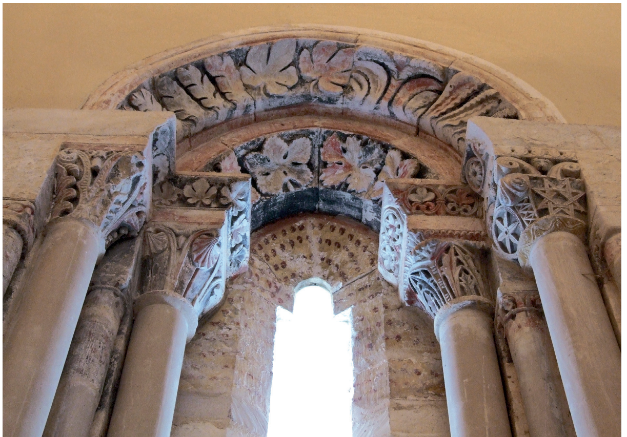
Burualdeko leihoak barrualdetik ikusita Ventanas de la cabecera vistas desde el interior