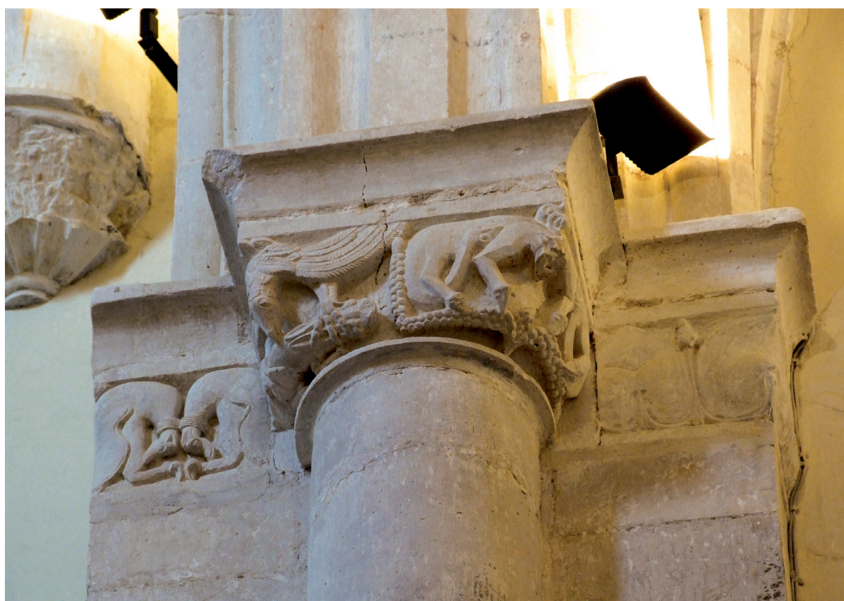
Garaipen-arkuaren ezkerreko kapitela