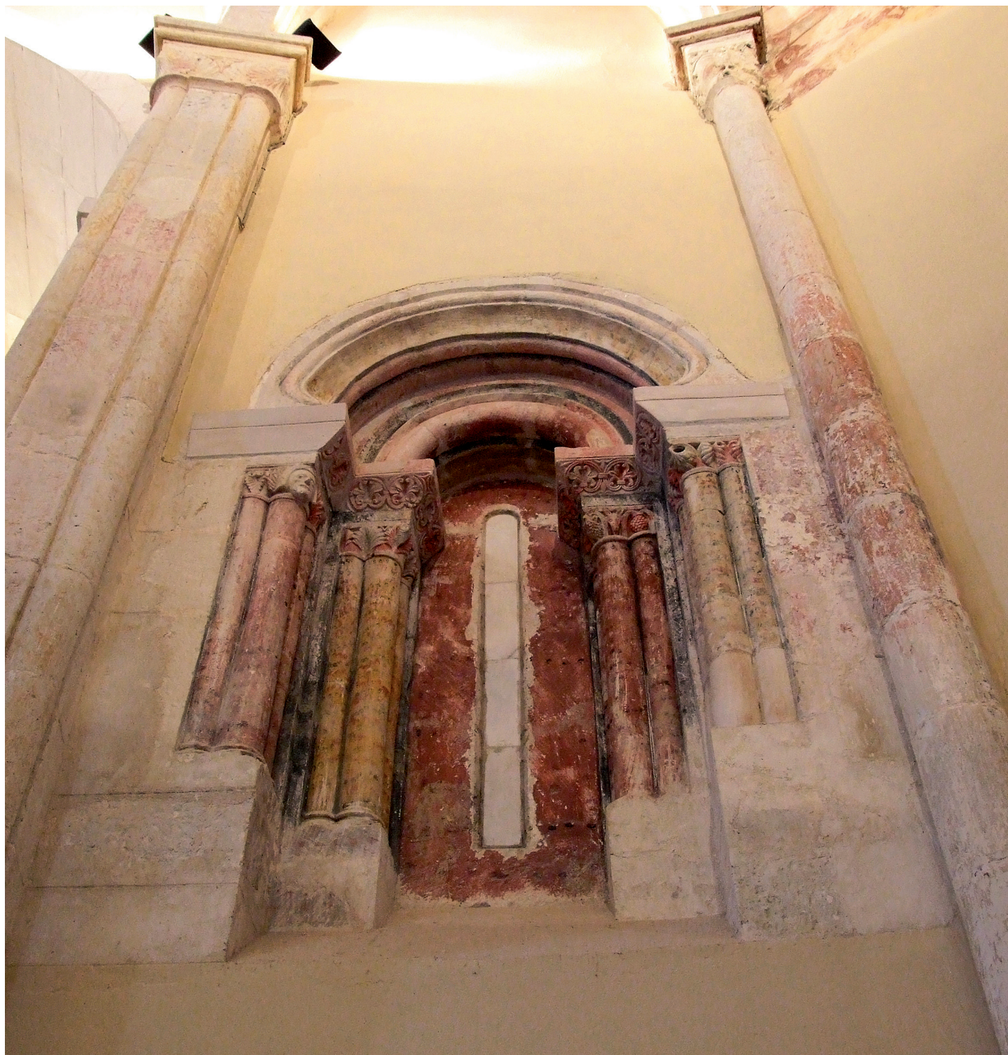
Burualdeko leihua barrualdetik / Ventana de la cabecera desde el interior

iraulita dituzten zurtoinak. Beste aldean orri estilizatuak, barrualdean trepano handia dutenak; eta kanpoaldean, sei petaloko lore bat zirkulu baten barruan barneko aldean, eta zortzi puntako izar bat, kanpoko aldean. Puntak gurutzatuta daude, eta bolutak ere badituzte, animalien buruak bi-