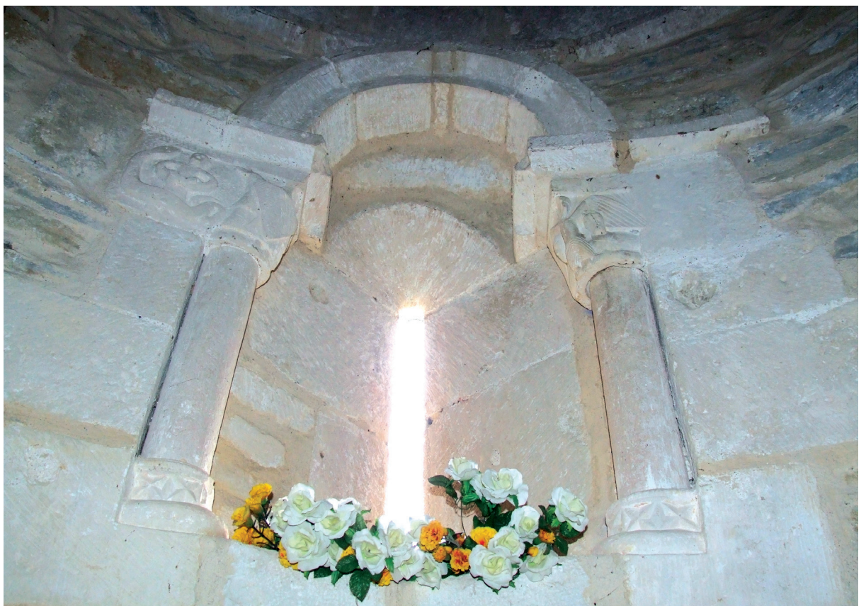
Barrualdea. Absideko leihoa Interior. Ventana del ábside