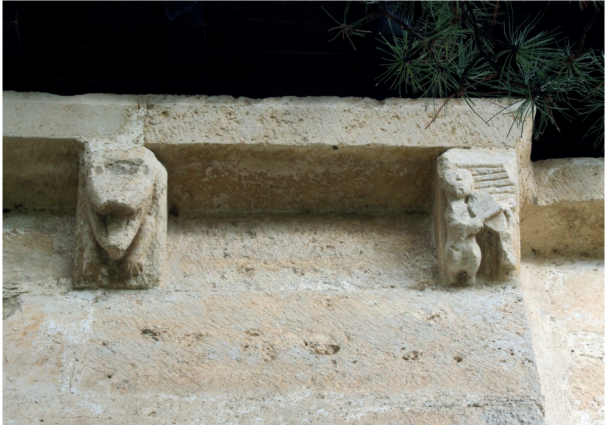
Absideko harburuak Canecillos del ábside