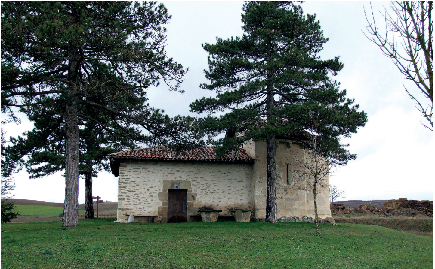
Ikuspegi orokorra / Vista general

En el exterior la cabecera se asienta sobre restos de sepulcros de piedra. El ventanal del ábside presenta de nuevo una única arquivolta moldurada, imposta y un par de columnas con basas sogueadas y capiteles decorados. El izquierdo, muestra una lucha de villanos, mientras que una tercera figura, en el lado exterior, mira la escena, y en la cara interior hay un cuadrúpedo; en el capitel derecho