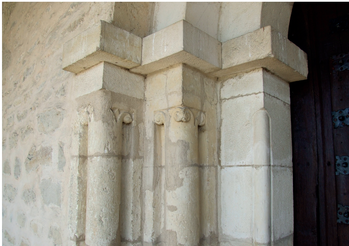
Portadako kapitetak Capiteles de la portada