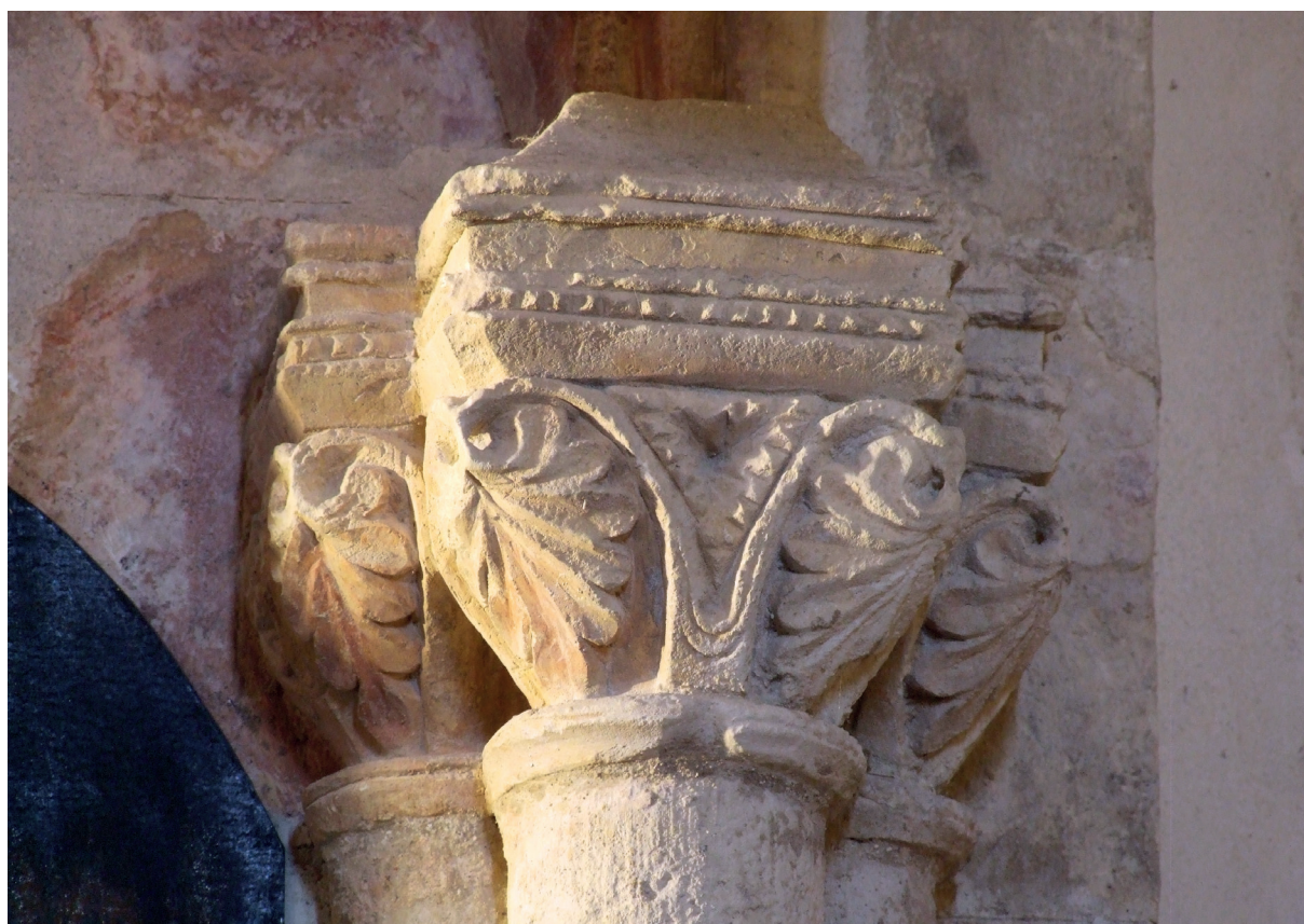
Horma-bobia errezelarekin iparraldeko horman. Kapitelak Nicho con dosel del muro norte. Capiteles