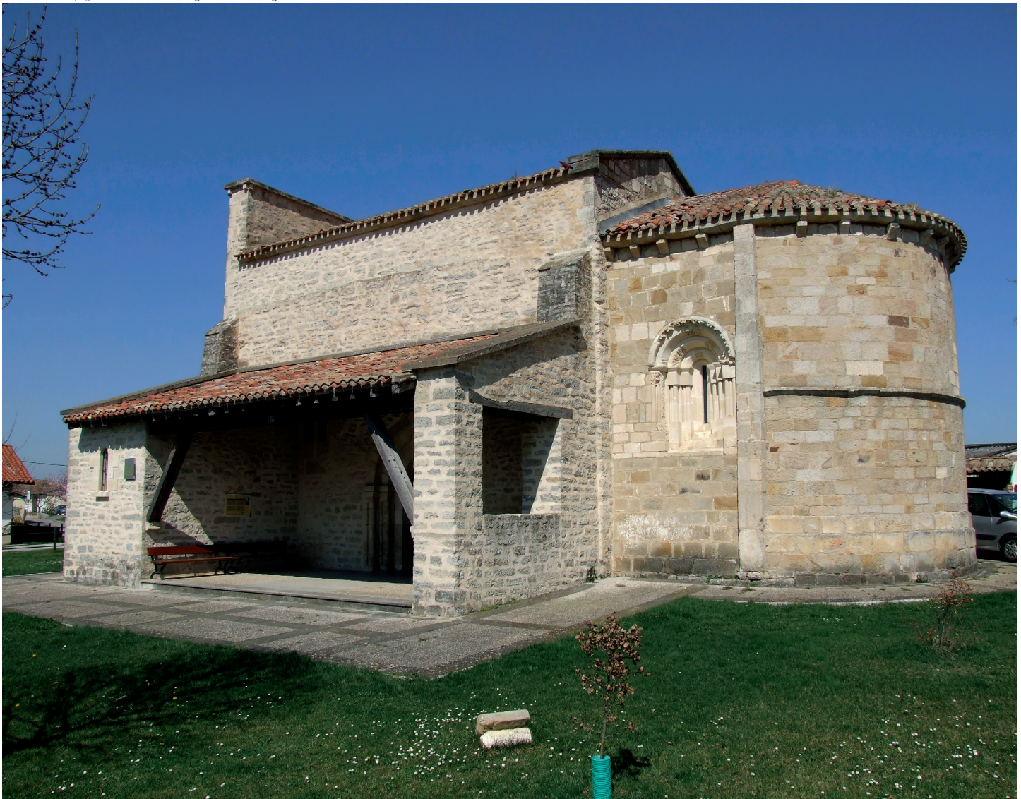
Elizaren ikuspegi orokorra / Vista general de la iglesia

L A IGLESIA DE SAN MARTÍN DE TOURS es un edificio de planta longitudinal de una sola nave cubierta por bóveda de cañón apuntada y dividida en cuatro tramos por sus correspondientes arcos fajones, que descansan sobre repisas con tres bolas cada una. La cabecera, semicircular y cubierta por bóveda de horno, se inscribe en el grupo de iglesias de la Llanada con ábside en semicírculo, como Alaitza, Argandoña, Ayala, San Juan de Arrarain o Trokoniz, escasas en Álava y que se fechan todas en torno a la primera mitad del siglo XIII. Se apoya en un arco sobre pilastras con semicolumnas en los ángulos. La construcción se completa con el tramo recto del presbiterio y un arco triunfal apuntado, que descansa en dos semicolumnas