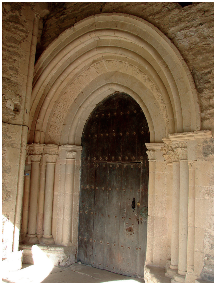
Elizaren portada / Portada de la iglesia

zen 1777an, eta berriro berritu zen 1994an, zurezko ha-beak jarritz.