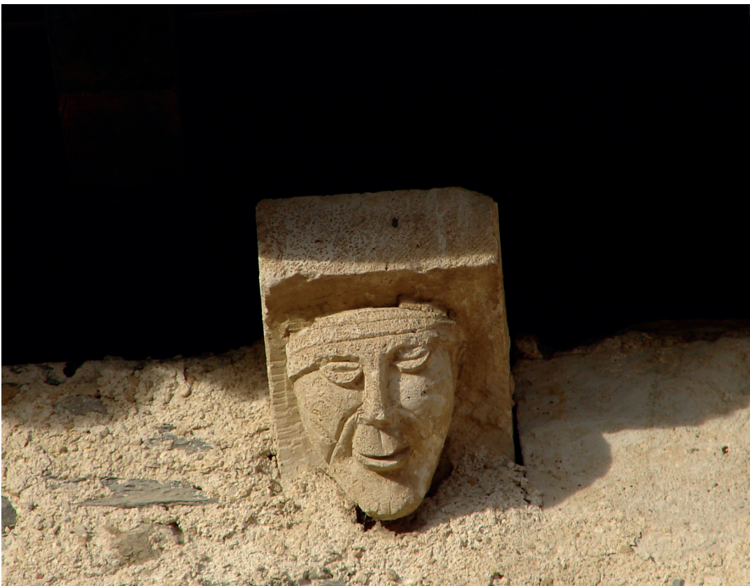
Hegoaldeko bormako barburua