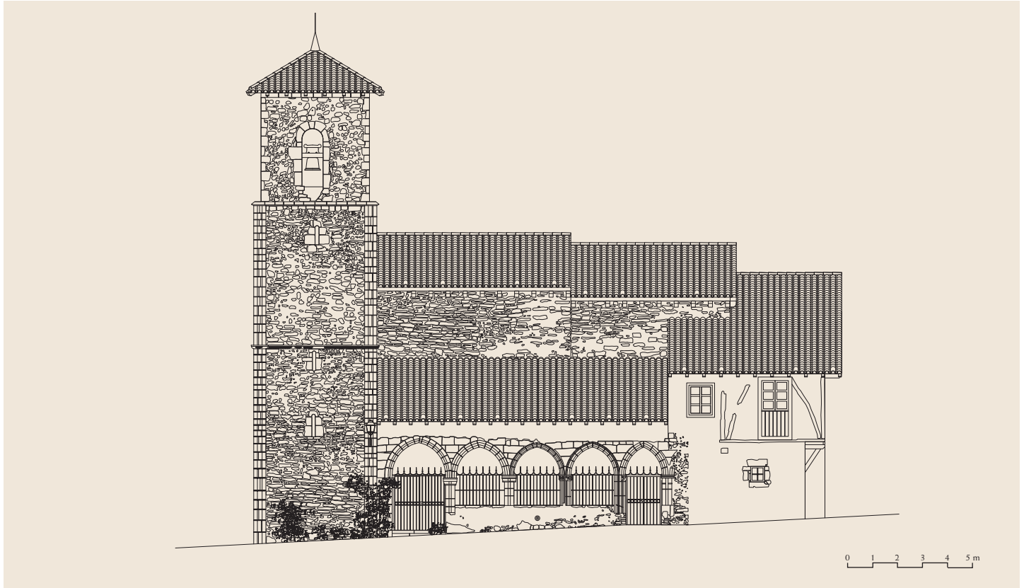
Hegoaldeko altxaera / Alzado sur