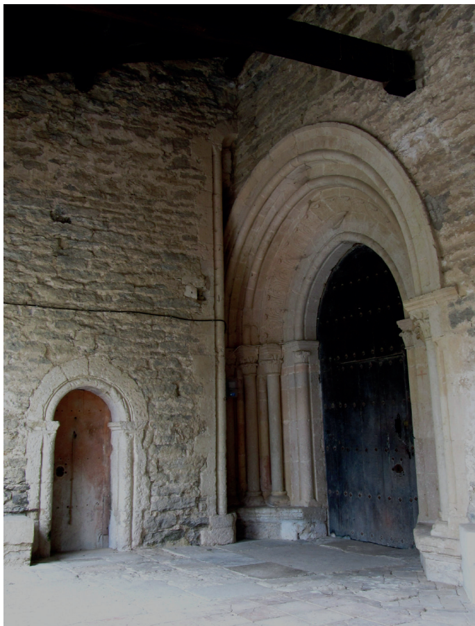
Dorrearen eta elizaren portadak / Portadas de la torre y de la iglesia