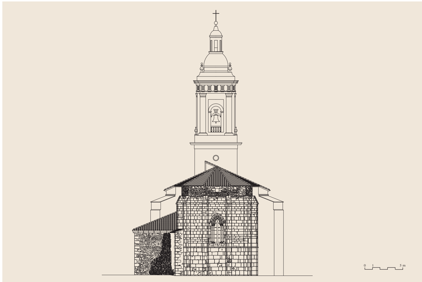
Ekialdeko altxaera / Alzado este