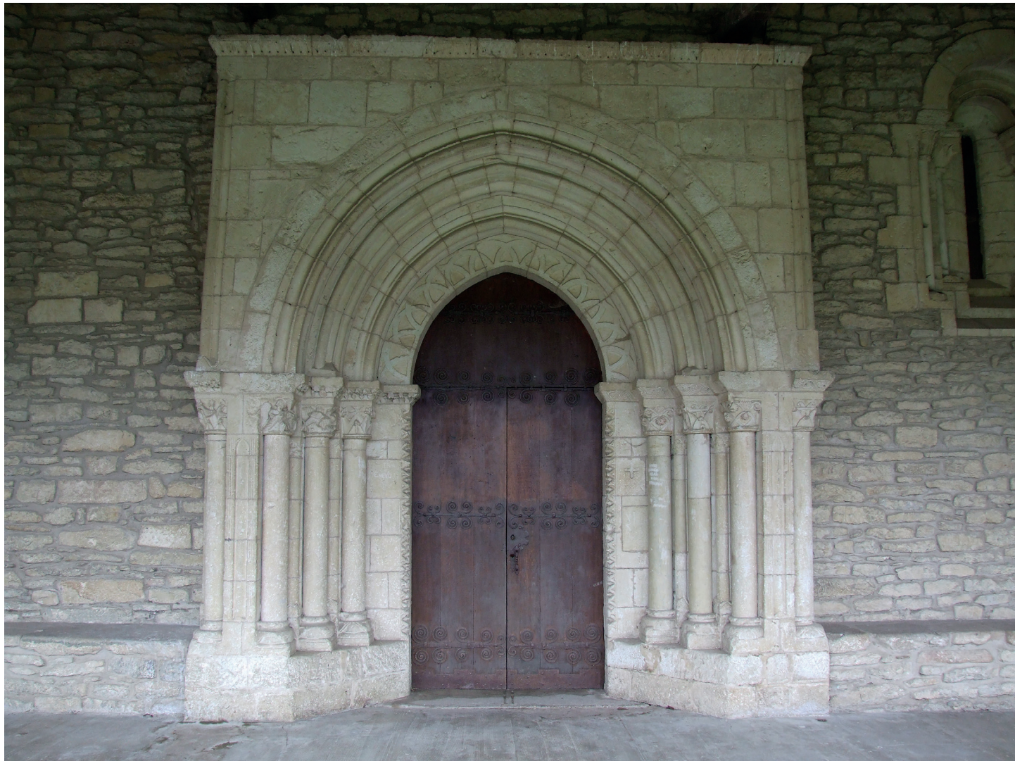
Portada / Portada

Las jambas se decoran con cuadrifolios salientes en su arista. Consta de cuatro columnas a cada lado, tres bajo las arquivoltas y una en cada flanco exterior, de fuste liso y basas de garras. Los capiteles son historiados y vegetales: de izquierda a derecha se ven cuatro palomas, dos de ellas picando tallos afrontadas hacia el vértice; lucha de un ángel con un dragón, el tema de San Miguel y el Demonio; dos dragones afrontados con cola de serpiente; y flores y