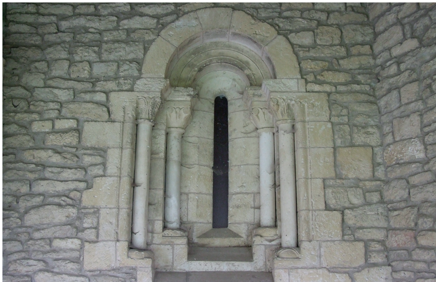
Hegoaldeko hormako leihoa / Ventana del muro sur

hondatuta dauden mentsuletan oinarritua. Fuste lisoko zutabe erromanikoen eta horien kapitelen aztarnak daude, kapitel horiek kiribildurekin eta gutxi markatutako erroleoekin, baita imposta zatiak ere. Horren gainean, harburu zoragarri batean munstro batek –hotz handak, begi urratuak, ilea eta belarri zorrotzak ditu– emakume bat irensten du; emakume hori ahotik zintzilik ageri da, hanketatik.