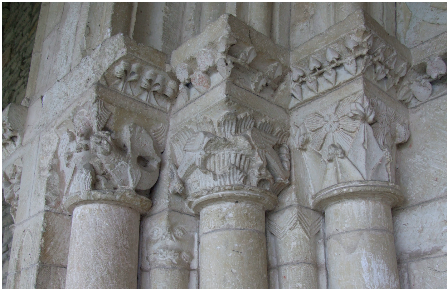
Portadako kapitlak / Capiteles de la portada

bi dragoi aurrez aurre suge-isatsarekin, eta erliebe laua duten lore eta hosto estilizatuak. Bi zutabeartek glouton edo irenslea erakusten dute, eta kapitel geometriko bat sigisagan. Eskuineko aldean kapitel guztiak begetalak dira, erdikoa zurtoin gurutzatuekin eta kiribildura lauekin, eta beste biak zurtoin gurutzatuekin eta kanporantz iraulita dauden hosto haragitsuekin. Zutabeartek begetalak dira, izaera naturalistakoak.