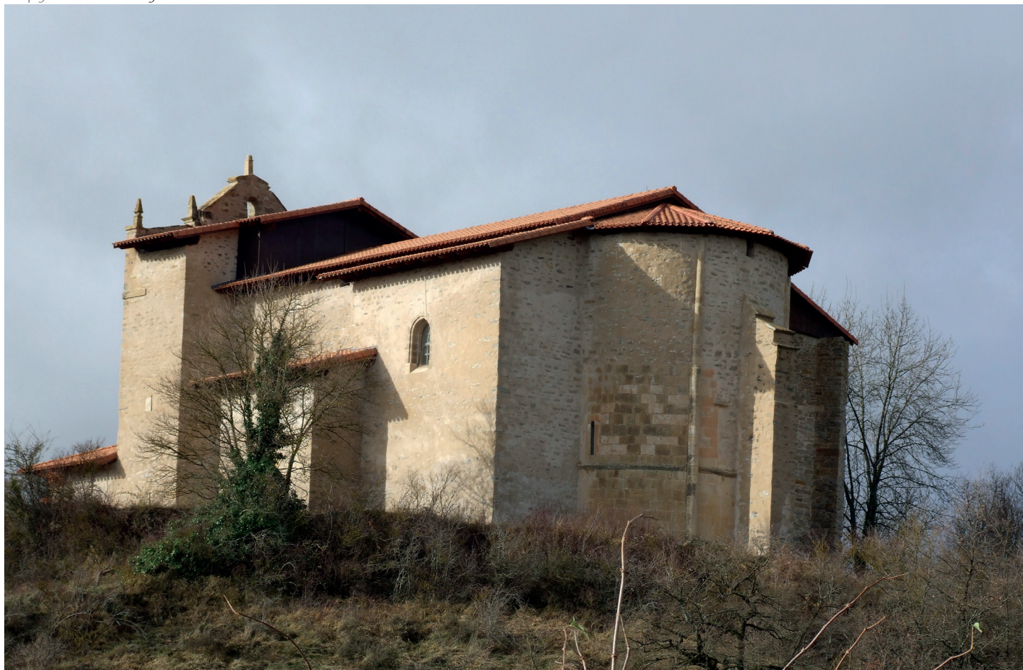
Ikuspegi orokorra / Vista general

E LEVADA SOBRE UN PROMONTORIO, la parroquia de San Vicente es un edificio del siglo xv de planta de cruz latina con portada, pórtico y espadaña, del siglo xvi,