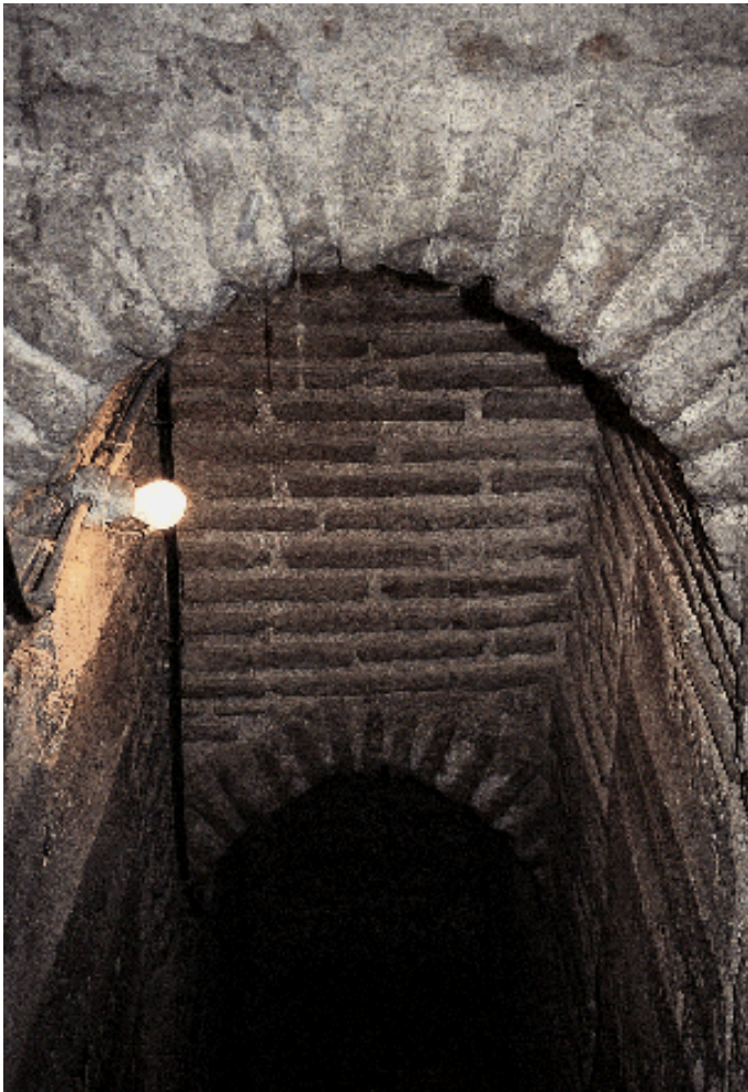
Detalle del interior de la torre