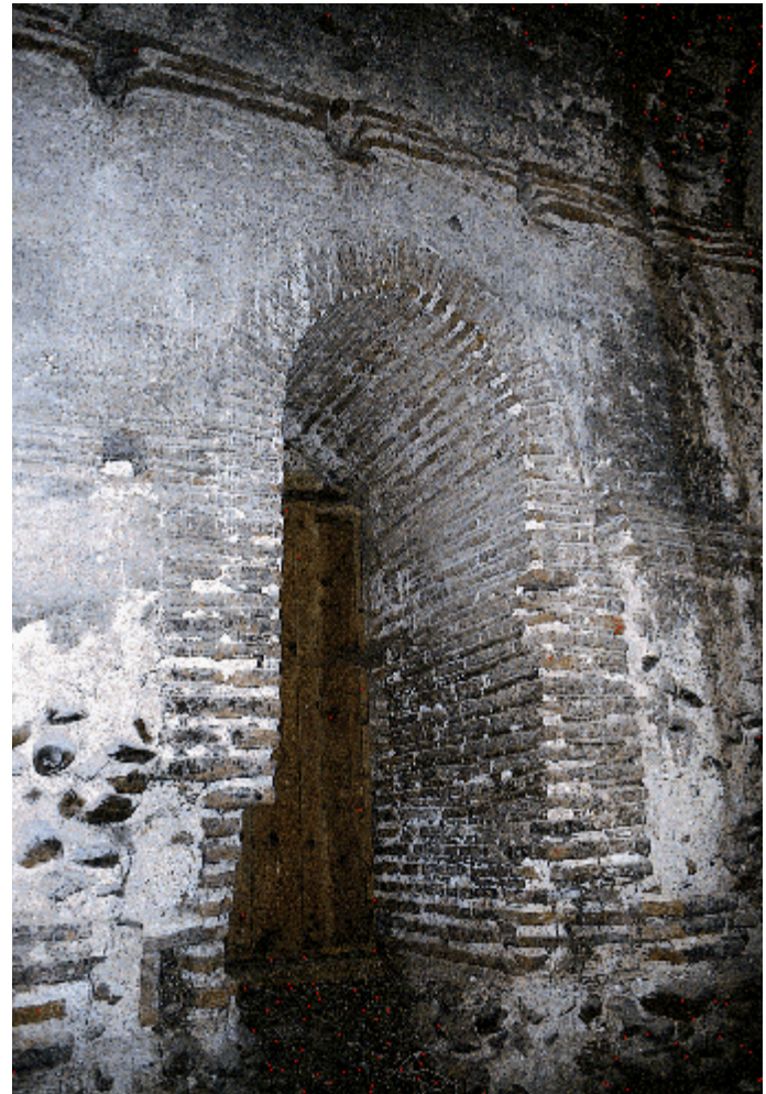
Detalle del interior de la torre