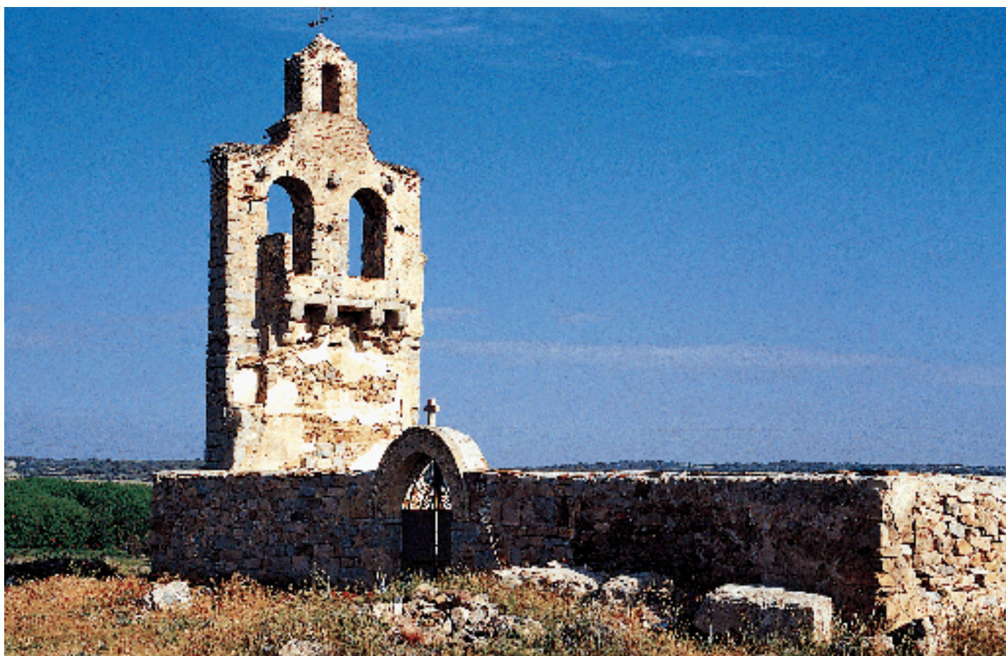
Fachada sur del cementerio

las escasas precipitaciones. Este antiguo templo se abandonó construyendo uno nuevo dentro del núcleo, donde se llevaron las piedras nobles y los objetos de culto. Esta decisión parece tomada desde las incomodidades que creaba tener que desplazarse no poco trecho por un camino