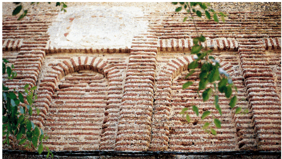
Detalle de la arquería del muro occidental