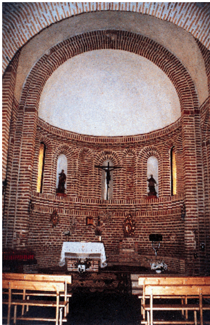
Interior del ábside

Estudio histórico: IHGB - Estudio artístico: JLGR Planos: AMRZ