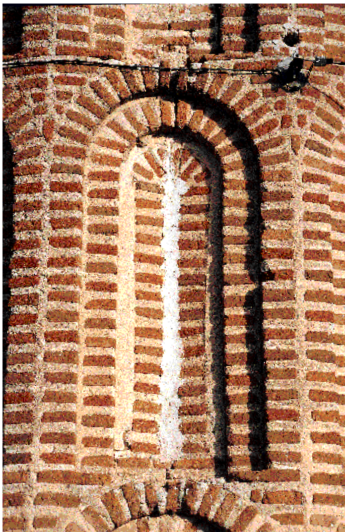
Detalle de la arquería

res en la parte superior para albergar el cuerpo de campanas. Hay aquí también una sencilla portada de apuntados arcos en el muro septentrional. La planta actual debe ser la primitiva, aunque muros y cubiertas estén transformados.