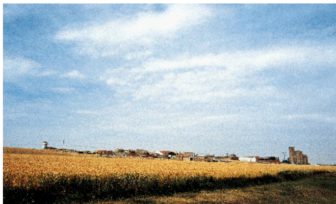
Vista general de Sinlabajos

Estudio histórico: IHGB - Estudio artístico: JLGR Plano: MTST