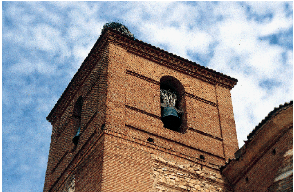
Detalle de la torre