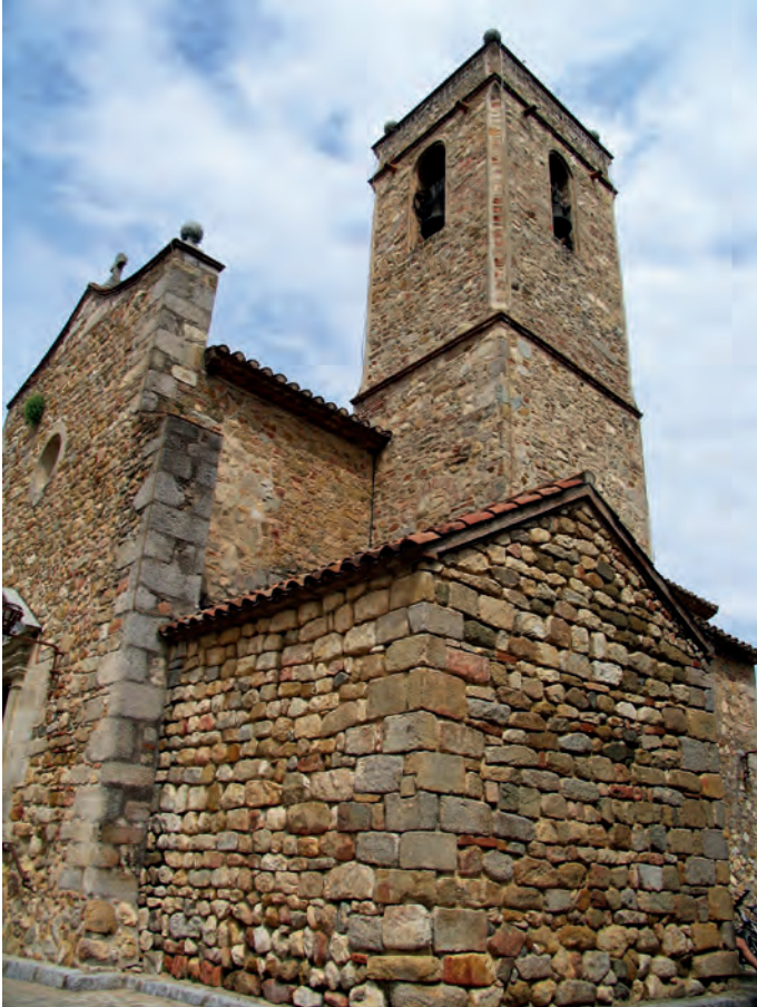
Vista general exterior con la capilla románica en primer término