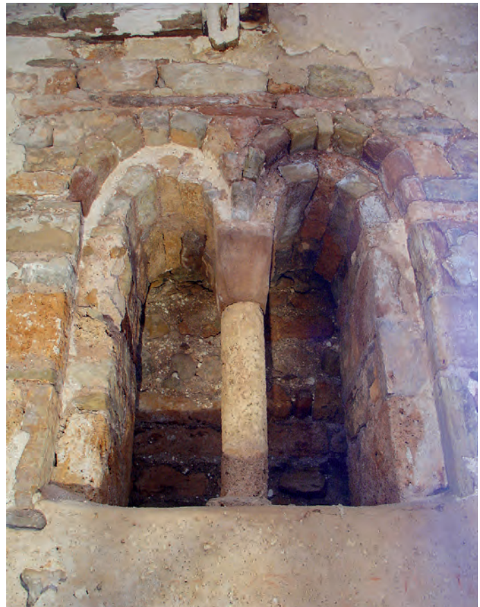
Ventana geminada del muro oeste

Pero otros trabajos sacaron a la luz interesantes hallazgos, como el producido en 1920, cuando se descubrió un pequeño recinto subterráneo bajo la iglesia (de 2,6 m de altura, una longitud de 5,6 m y una anchura de 5 m) al que se accede a través de un pequeño túnel situado en el extremo norte. En su