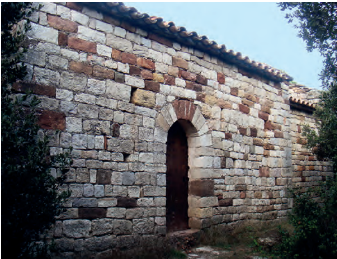
Portada en el muro sur

la presencia de un banco corrido adosado a los muros septentrional y occidental.