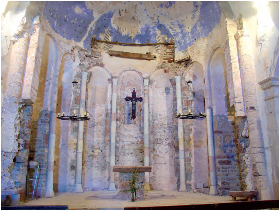
Interior del ábside