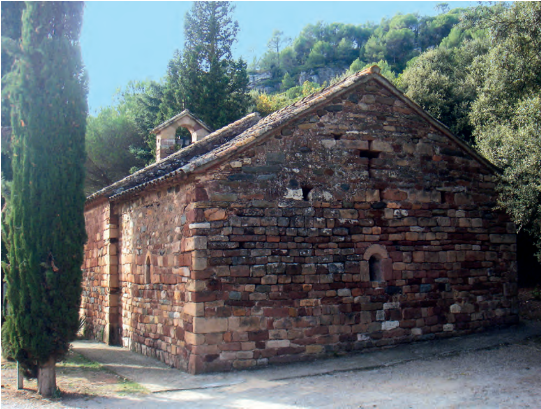
Vista general de la fachada occidental