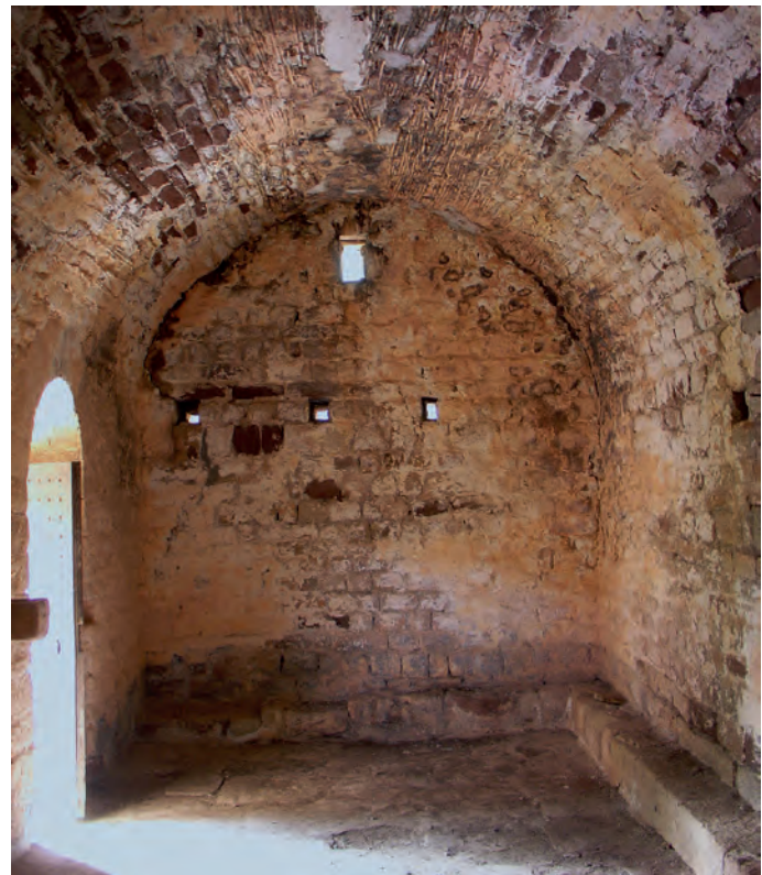
Interior hacia los pies