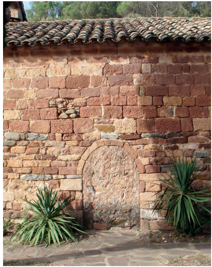
Portada tapiada en el muro sur