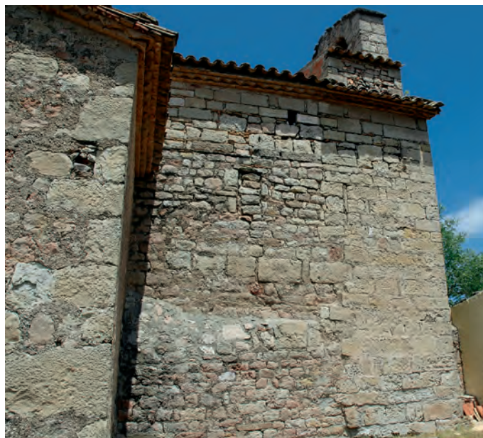
Muro sur con fragmentos de la fábrica románica en la parte inferior