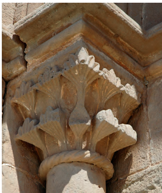
Capiteles del lado oeste de la portada meridional

cañón, y de las que hoy se conserva el tramo más cercano a la antigua cabecera. Los arcos formeros que separaban las naves fueron sustituidos por dos grandes arcos apuntados transversales a la nave actual.