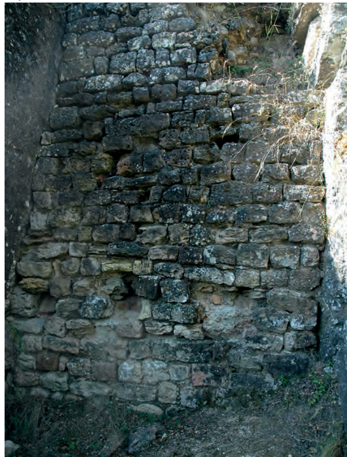
Fragmento de muro del sector norte

181-182; GINESTA I BATLLORI, S., 1987, p. 97; MARTÍN I EXPÓSITO, R., 1986 (1987-1988), pp. 233-234; MIQUEL I ROSELL, F., 1945-1947, I, pp. 203-204, doc. 192; ORDEIG I MATA, R., 1999, II, pp. 730-733, doc. 995, 733-734, doc. 996; SOLÀ I MORETA, F., 1955, pp. 30, 143.