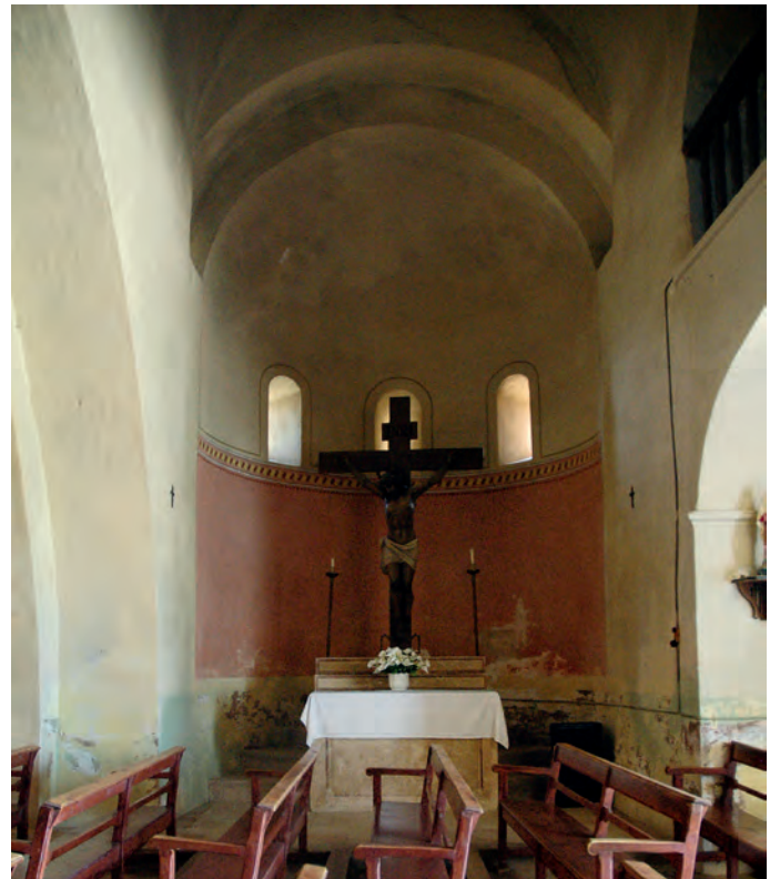
Interior del ábside central de la cabecera románica