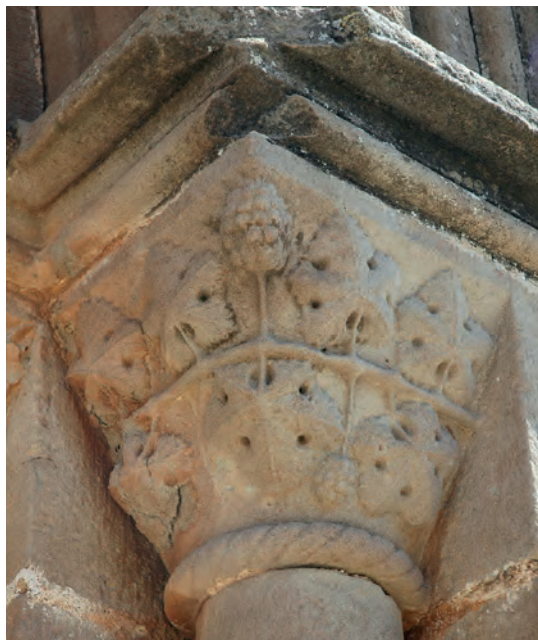
Capiteles del lado este de la portada meridional