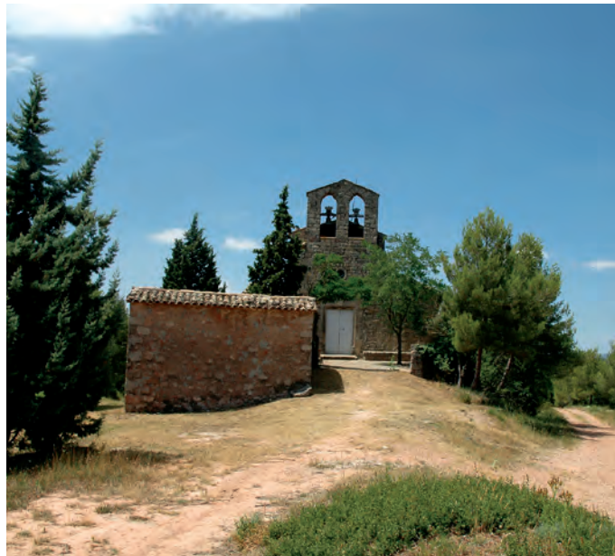
Vista general del actual edificio

BENET I CLARÀ, A., 1986a, p. 271; CASTELLS CATALANS, ELS, 1967-1979, V, pp. 621- 622; CATALUNYA ROMÀNICA, 1984-1998, XI, pp. 42, 189-190; GINESTA I BATLLORI, S., 1987, pp. 99-100; MARTÍN I EXPÓSITO, R., 1986 (1987-1988), pp. 235, 237; VILLEGAS I MARTÍNEZ, F., 1982, pp. 79-80.