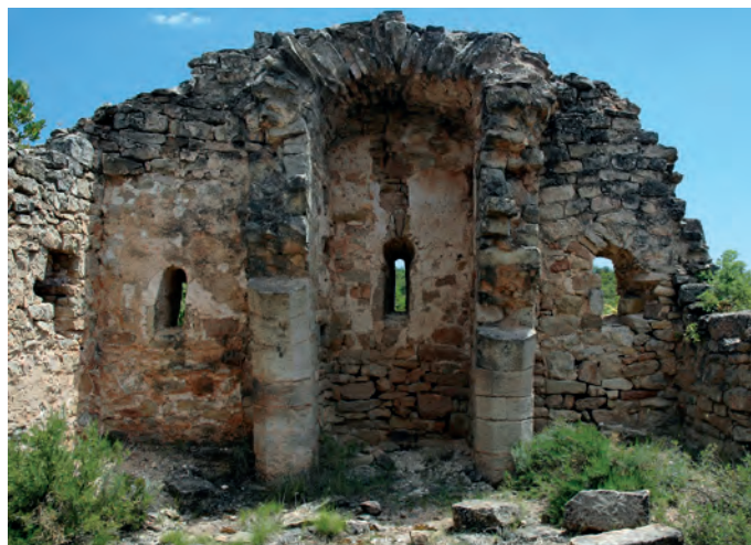
Interior de la cabecera