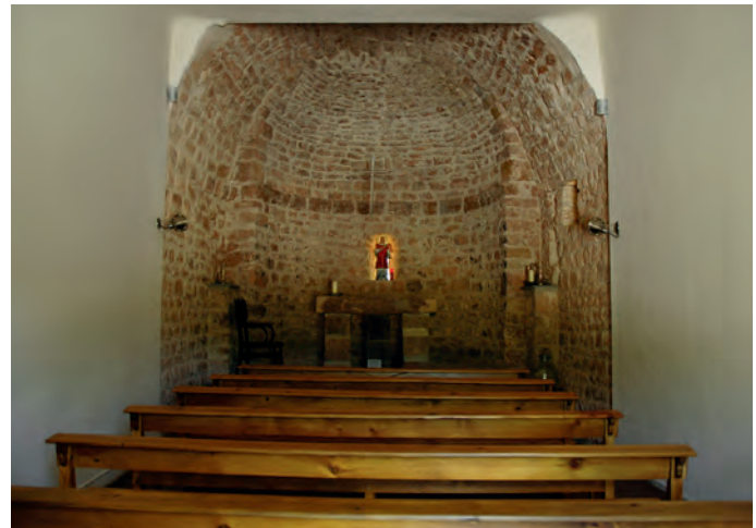
Vista general del interior

CATALUNYA ROMÀNICA, 1984-1998, XI, pp. 25, 48, 185-186; GINESTA I BATLLORI, S., 1987, p. 100; JUNYENT I MAYDEU, F. y MAZCUÑAN I BOIX, A., 1981, p. 61; MARTÍN I EXPÓSITO, R., 1986 (1987-1988), pp. 234, 237; VILLEGAS I MARTÍNEZ, F., 1982, p. 77.