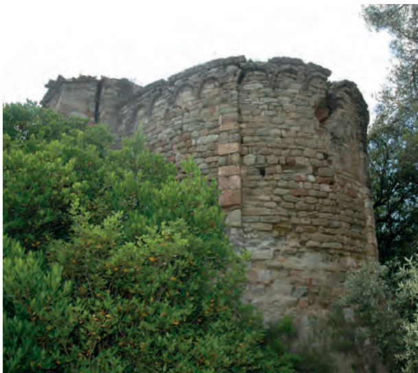
Ábside desde el Suroeste