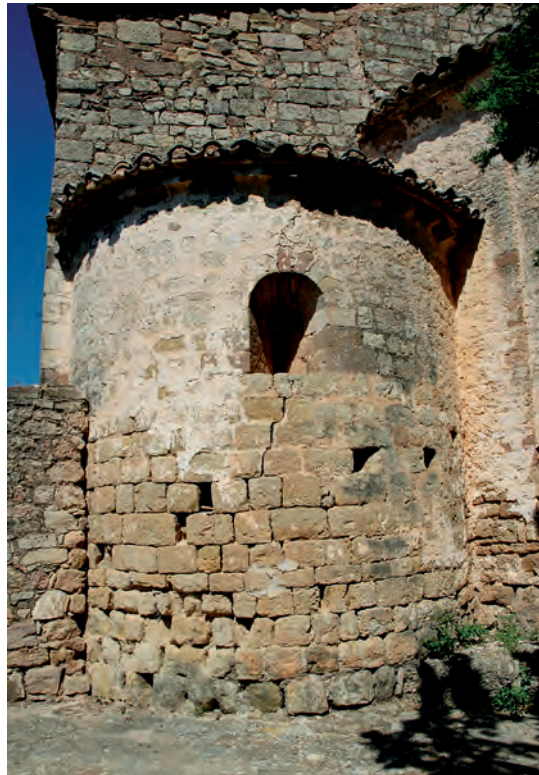
Absidiolo sur de la cabecera