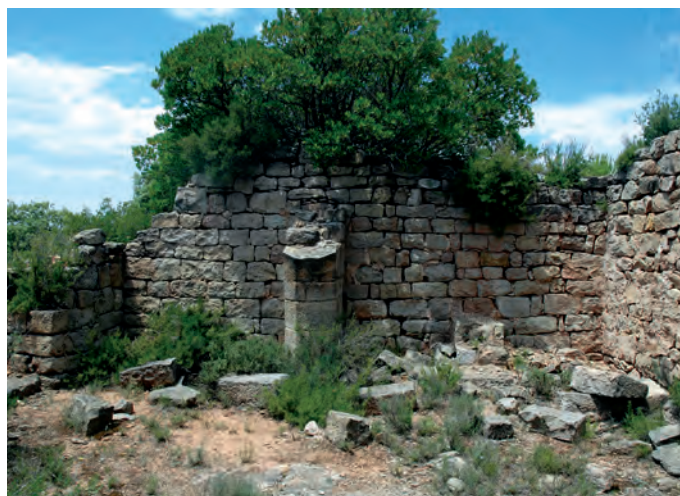
Interior del muro oeste