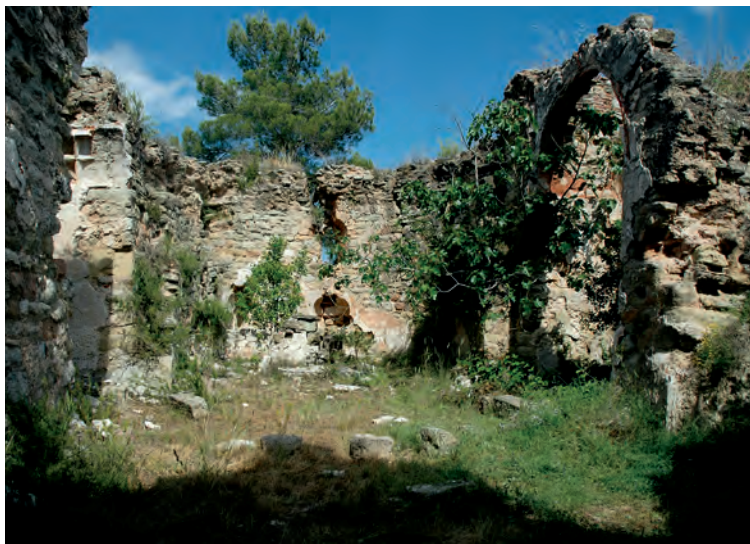
Interior de la nave y ábside desde el Oeste