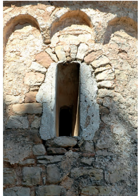
Ventana del absidiolo norte

Como hemos anunciado la transformación más radical de la iglesia tuvo lugar en el siglo XVII, en torno a 1633, cuando se construyó una capilla en el ángulo nordeste de las naves, que constituye un cuerpo transversal más alargado que estas. Esta capilla está destinada a albergar el altar principal