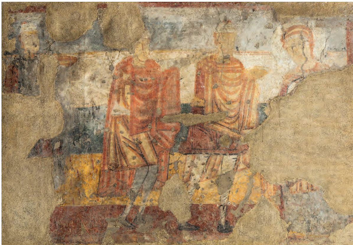
Escena de la Epifanía ©Museu Diocesà de Barcelona.