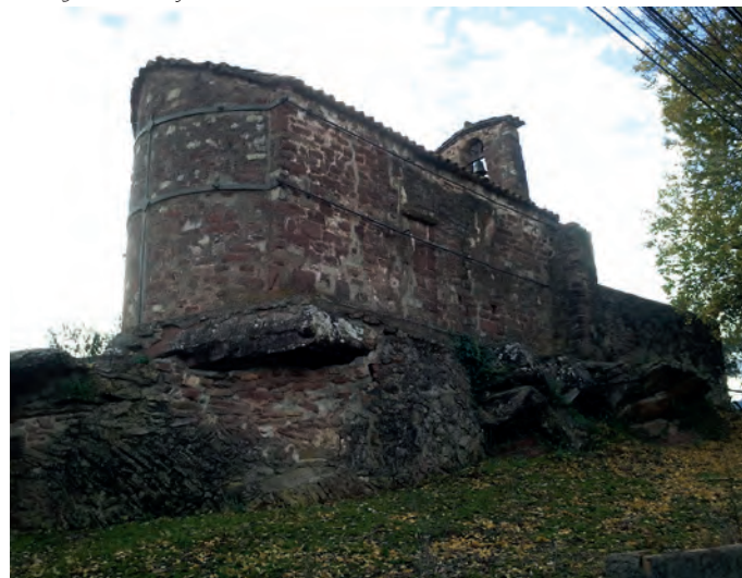
Vista general de la fachada norte

El acceso a la construcción se realiza a partir de una abertura en la fachada occidental de factura posterior a la iglesia románica. Así, vemos como todo este muro conforma un cuerpo adosado a la nave que incluye una espadaña con una campana dentro de un arco semicircular. El interior