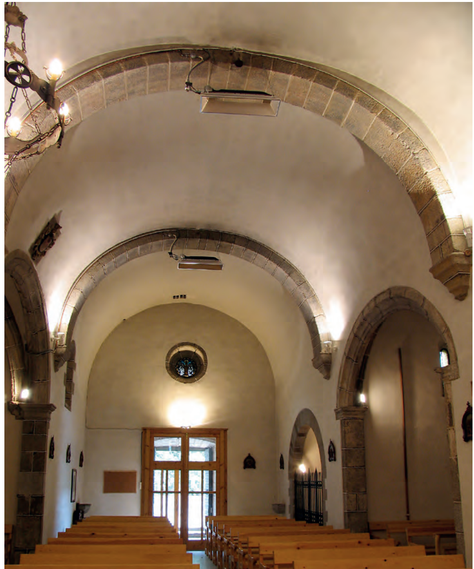
Arcos fajones del interior

CATALUNYA ROMÀNICA, 1984-1998, XX, p. 490.