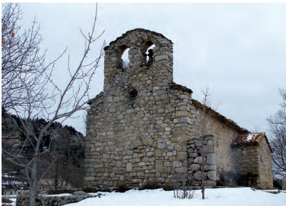
Vista general de la fachada oeste

que la iglesia y el lugar de Fumanya eran dependencias del monasterio. Debido probablemente a esa subordinación, la iglesia nunca fue parroquial.