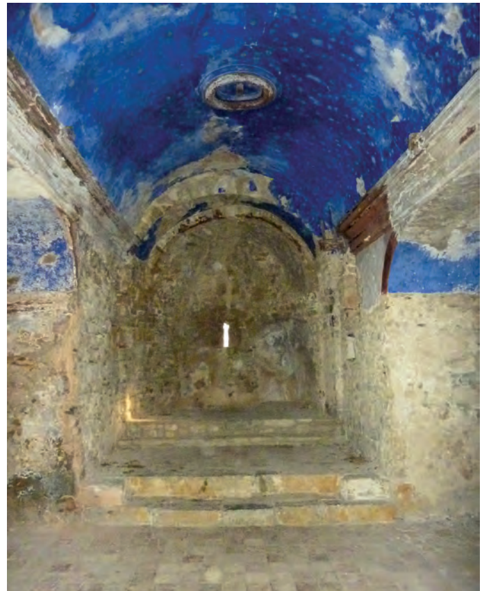
Vista general del interior

un aparejo de medianas dimensiones y bastante regularidad. El interior muestra restos de decoración neoclásica, como la capa pictórica que cubre la bóveda de medio cañón ligeramente apuntado de la nave.