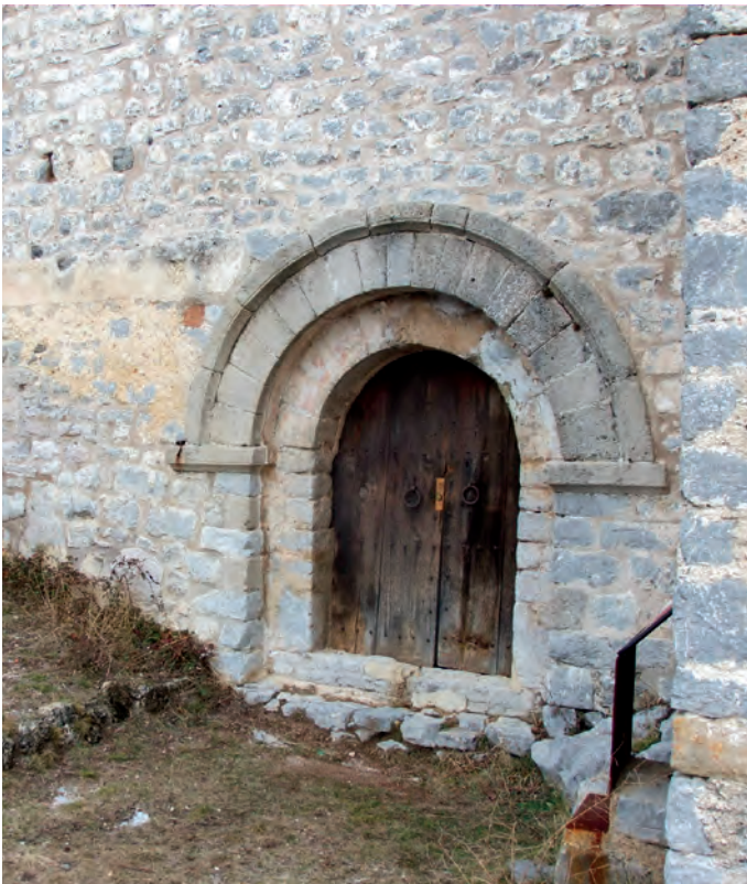
Portada en la fachada sur

partes corresponden al edificio primitivo. De todos modos, fue una iglesia de una sola nave cuyo ábside debió de ser sustituido posteriormente por la actual cabecera de testero recto. A los pies del edificio se eleva una torre campanario con cuatro aperturas, una en cada lado. Las capillas abiertas en los muros norte y sur se deben también a remodelaciones de época moderna, así como la muy modificada nave, cubierta con una bóveda de ladrillo. Así pues, parece que las partes más antiguas hay que buscarlas en la zona occidental del edificio. En el lado sur destaca la puerta de acceso, de doble arco en gradación de medio punto y adovelado. En su parte externa, un guardapolvos arranca de las impostas que marcan los salmeres del arco. Se considera que estos (escasos) vestigios románicos datan del siglo XII.