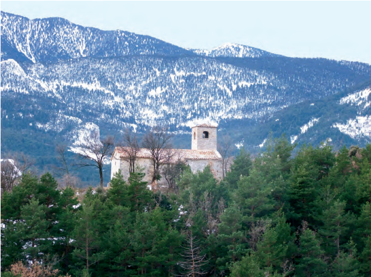
Vista general del templo