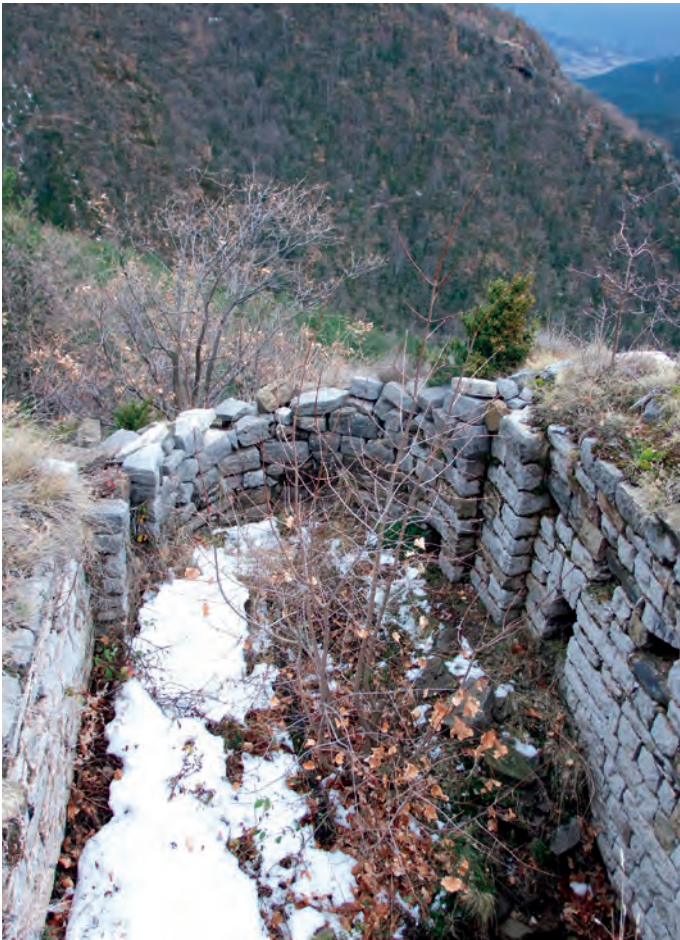
Vestigios del perímetro del ábside