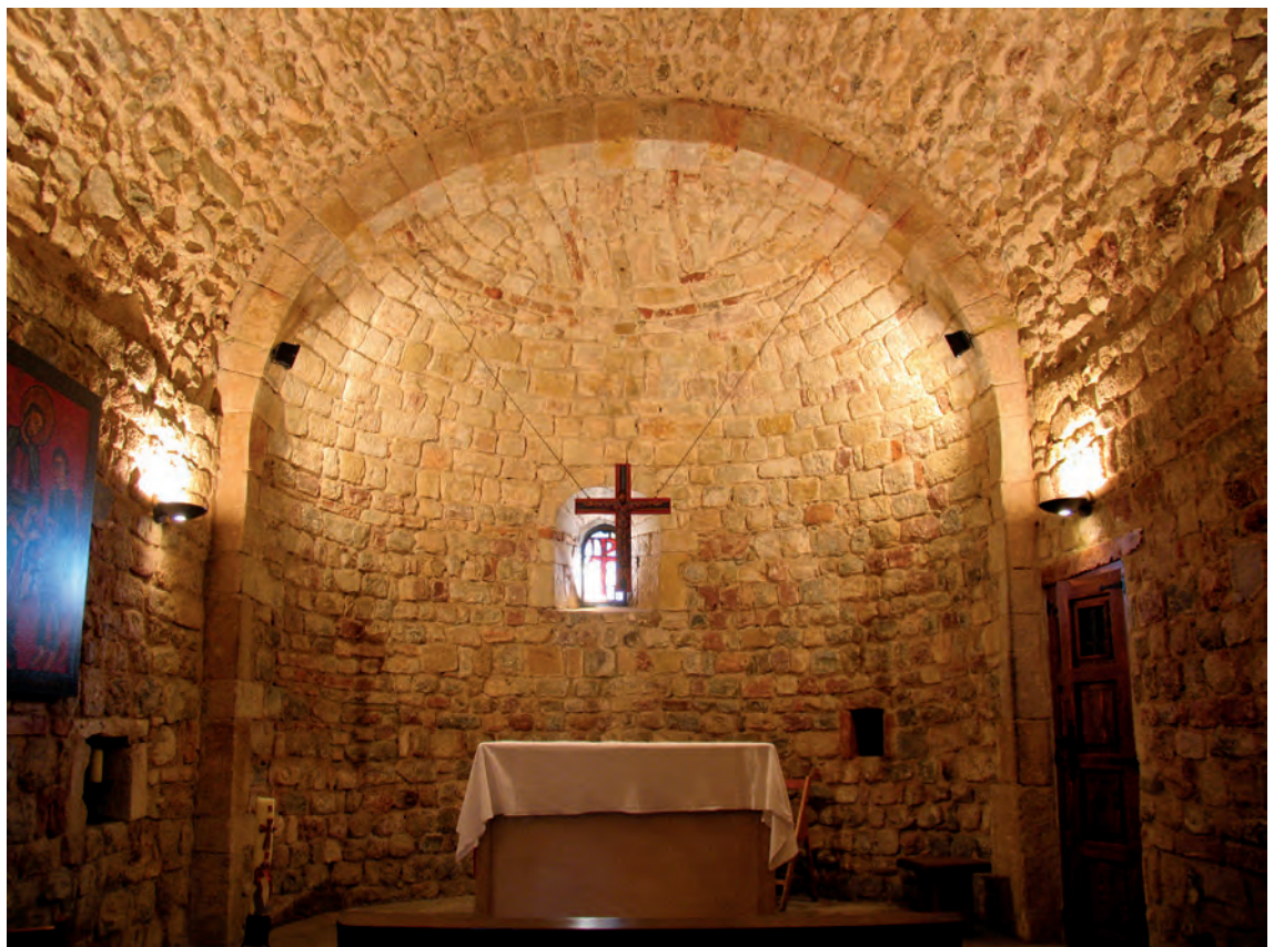
Vista general interior