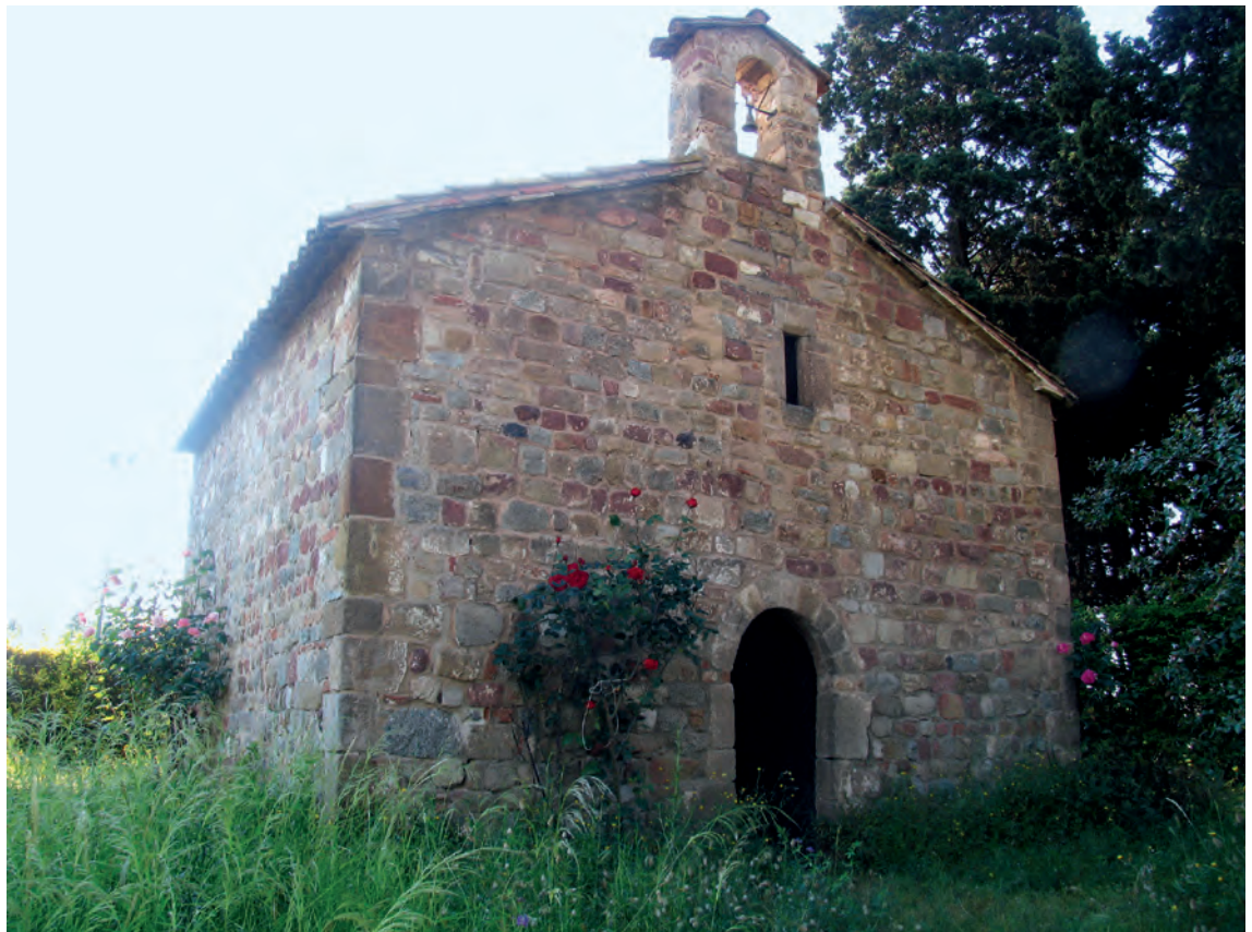
Vista general de la iglesia