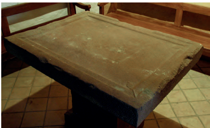
Ara de altar

no se conservan muchas edificaciones con este sistema de cubrición pero sí muy conocidas: Sant Climent y Santa Maria de Taüll, en el Valle de Boí (Lleida). En el centro del ábside se abre un pequeño vano rectangular, actualmente tapiado, mientras que en el muro sur se abren otras dos ventanas, también rectangulares y abocinadas (la más cercana al ábside en forma de aspillera). Una cuarta ventana se abre en la fachada occidental, pero de factura moderna. En relación a sus muros, aparecen cubiertos con revoco en su mayoría, excepto en el exterior del muro norte, y muestran un paramento irregular realizado con lajas de pizarra y piedra calcárea.