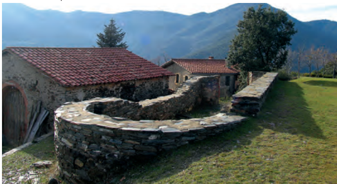
Restos de la capilla de Santa Anastàsia

templo no se documenta hasta 1776, cuando aparece como propiedad de la parroquia de Sant Julià del Montseny.