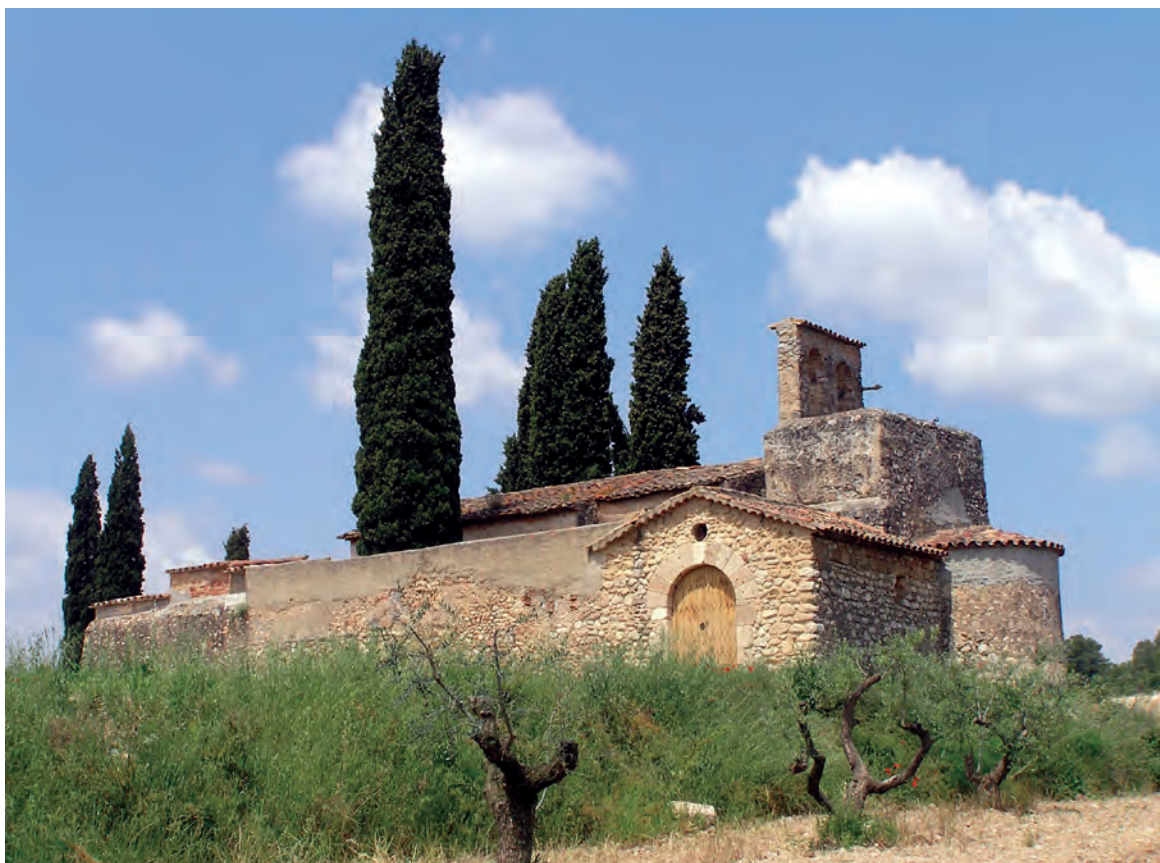
Vista del conjunto

Esta iglesia obtuvo la consideración de dependiente o sufragánea de la parroquia de Santa María de Piera, informa-