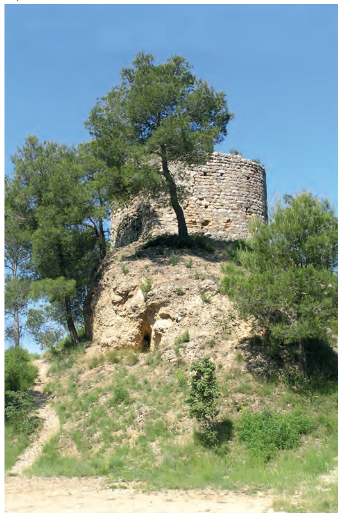
Emplazamiento de la torre

En el mismo siglo XII aparecen las primeras menciones documentales. Así, en 1143 se menciona un tal Bernat Guifré de Bedorc, y en 1160, en el testamento de Enric, se hace