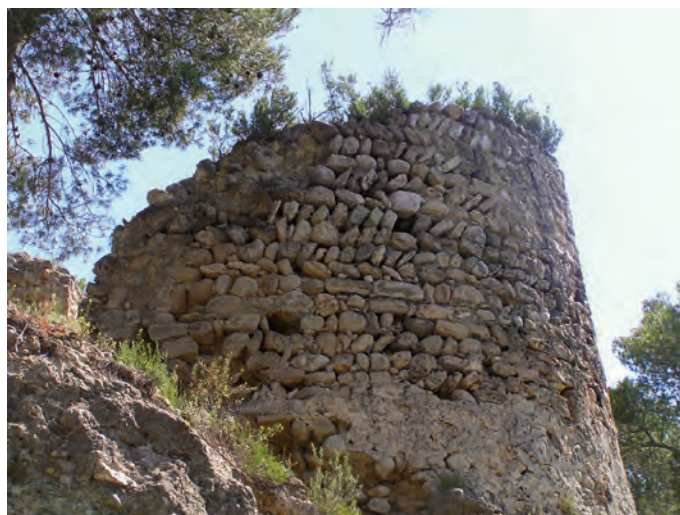
Detalle del aparejo

Es difícil establecer una relación entre las diversas construcciones de los dos cerros, pues no sabemos si la torre era