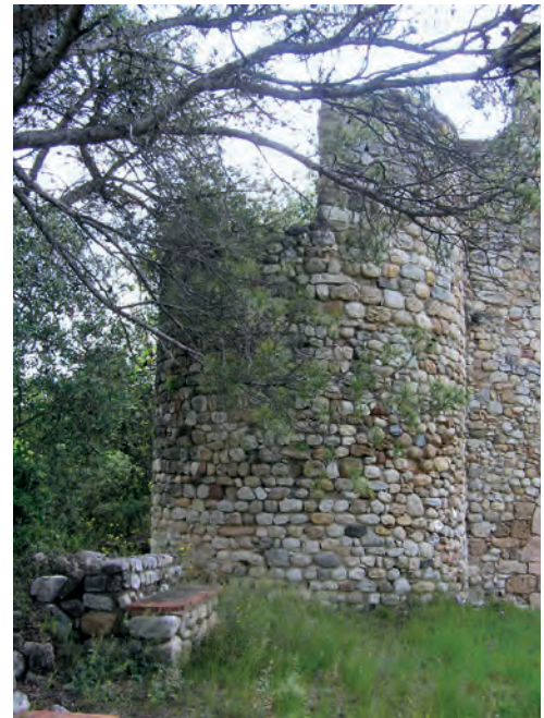
Torre del antiguo castillo

reaparece en el tercer acta de consagración de la canónica de Santa Maria, de 1163, en la que figura como capellam ecclesie sancti Nicholai de ipso Fraxino .