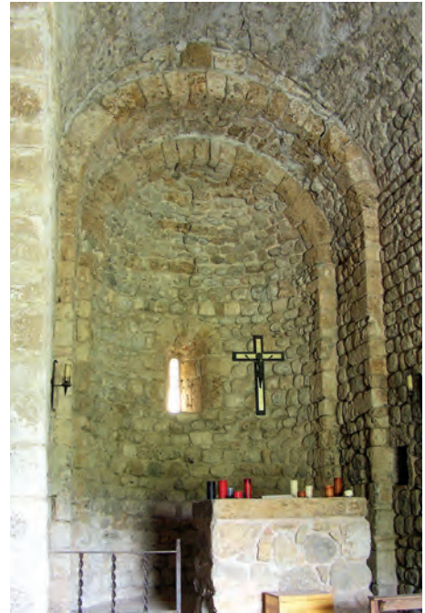
Interior del ábside