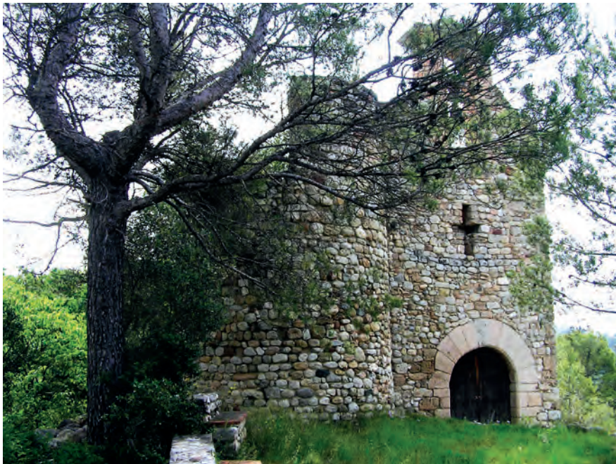
Iglesia de Sant Nicolau y restos del castillo