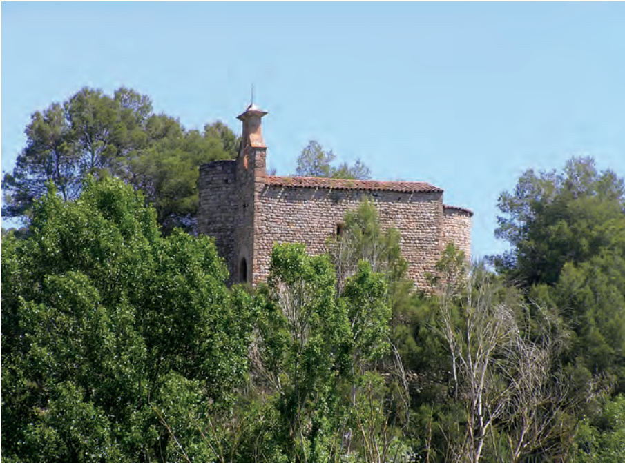
Iglesia de Sant Nicolau