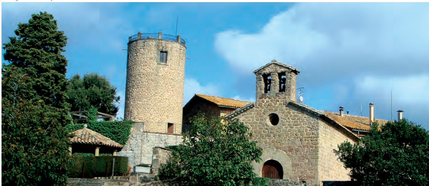
Vista general del conjunto

ron de castellanos. En 1056, Ermessenda de Balsareny, mujer de Sunifred II de Lluçà, cedió a su hijo Ramon el alodio de Quer (sin mencionar la existencia del castillo). Y a su muerte, pasó a manos de su hermano Folc, quien a su vez lo cedió al monasterio de Ripoll. Pero otro hermano, Berenguer Sunifred de Lluçà, futuro arzobispo de Tarragona y obispo de Vic, quiso recuperar el alodio y el castillo y cederlos a la canónica de Vic. Esta donación quedó confirmada en el testamento