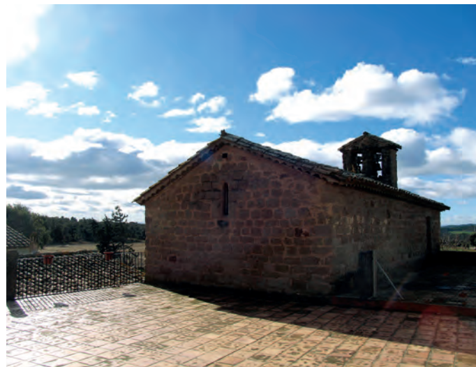
Fachada oriental de la capilla