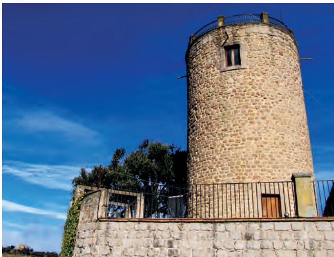
Vista general de la torre del castillo