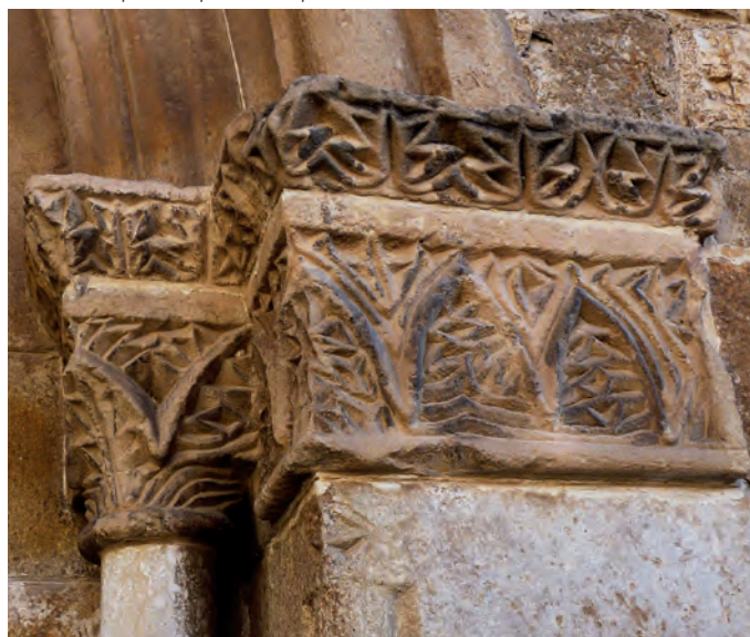
Detalle de capitel e imposta de la portada