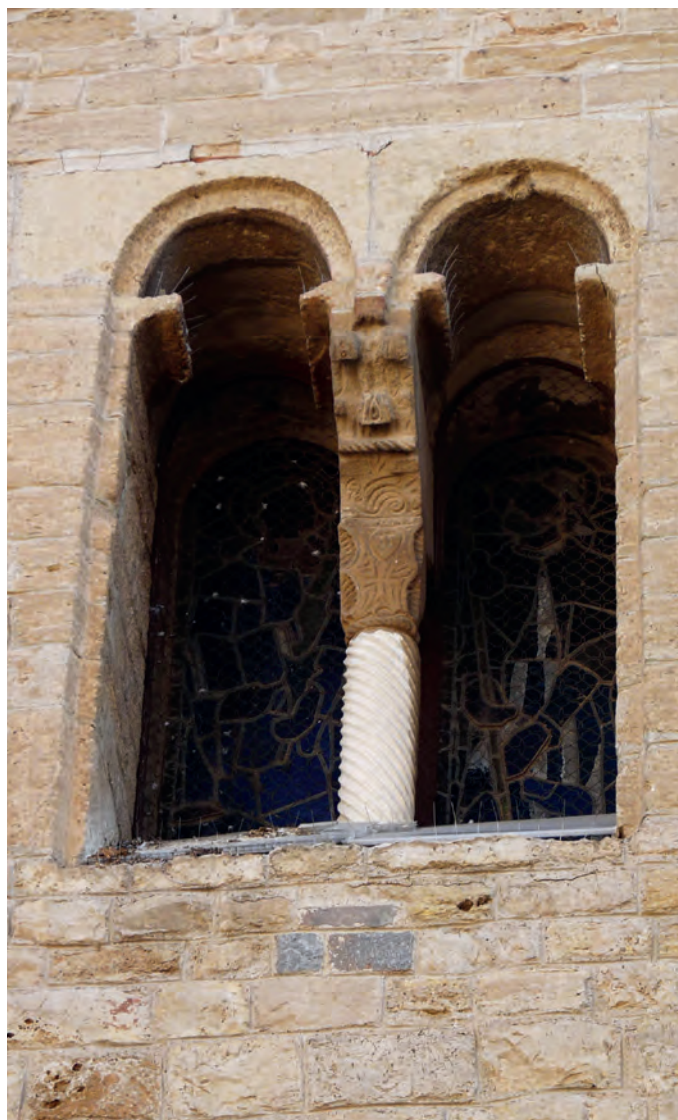
Ventana geminada de la fachada oeste

La columna estriada se remata con un capitel de piedra en el que se representa un esquemático rostro humano de forma almendrada dispuesto sobre una cruz de brazos dobles. El tipo de rostro ha sido puesto en relación con las decoraciones existentes en algunas impostas de Sant Hilari d'Abraera (Baix Llobregat) y de Sant Pere de les Puel·les (Barcelona). El capitel cuenta en la parte superior de su cesta con un friso ornamental en diente de sierra, mientras que el registro inferior presenta una ornamentación en sogueado, motivo que también puede localizarse en las impostas de la iglesia