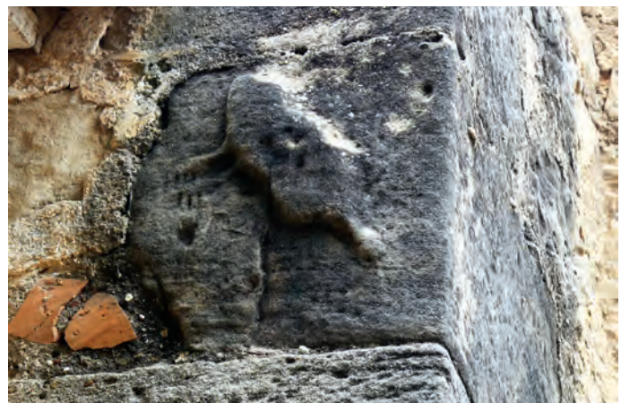
Sillar con restos escultóricos