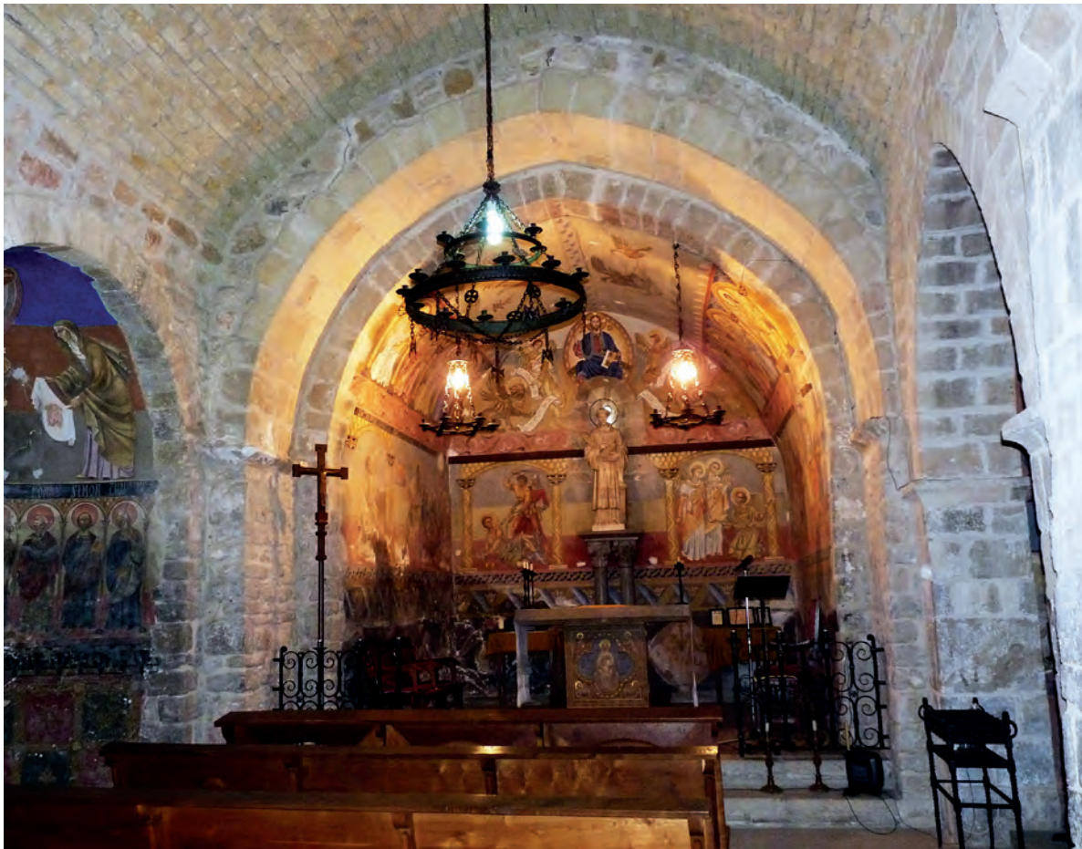
Vista del interior

con incisiones geométricas y, exteriormente, en el ángulo meridional que une la nave con el ábside existe una dovela con una decoración en relieve muy erosionada, identificada con una figuración animal en actitud de trepar.