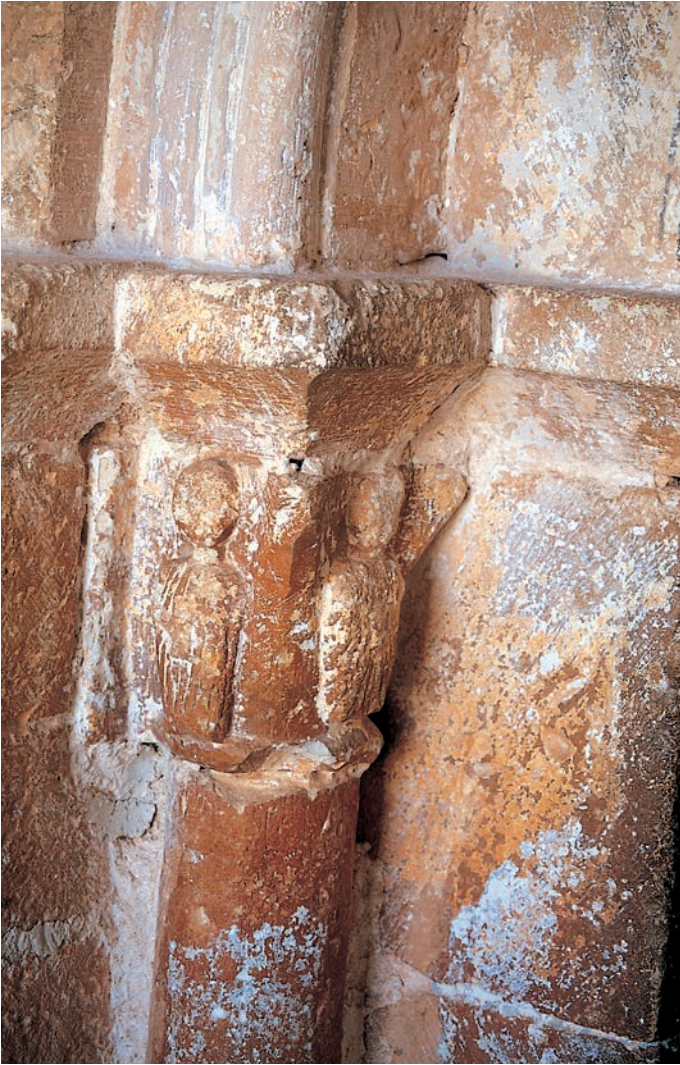
Capitel del lado izquierdo de la portada