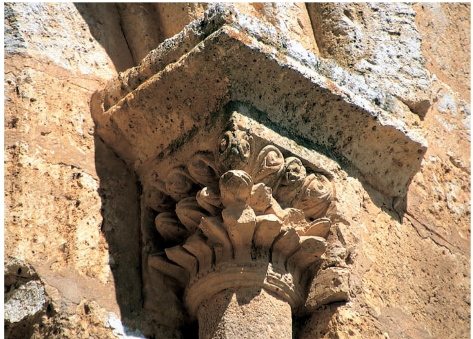
Capitel de una ventana absidal

En el interior, la capilla mayor se cubre con bóveda de horno y de cañón apuntado arrancando en ambos casos