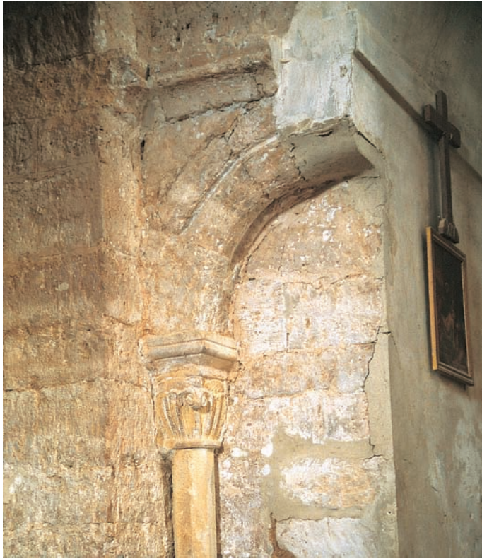
Restos de la arquería del presbiterio