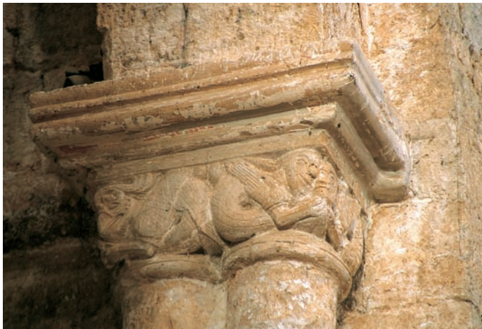
Capitel del arco triunfal

de una imposta de cuarto de bocel. En los muros del presbiterio se disponían arquerías ciegas que fueron destruidas al abrirse el acceso hacia las capillas laterales. En el lado del evangelio quedan restos de un arco con bocel y de un capitel con dos dragones afrontados y en el de la epístola otro con motivos vegetales. Un capitel doble decorado con hojas (38 × 30 × 23 cm) que se conserva en la sacristía y otro de ángulo (25 × 23 cm) depositado a los pies de la nave del evangelio proceden probablemente de estas mismas arquerías. Esta articulación del tramo presbiterial la hallamos también en otras iglesias del entorno, como la parroquial de Padilla de Arriba y la ermita de Padilla de Abajo.