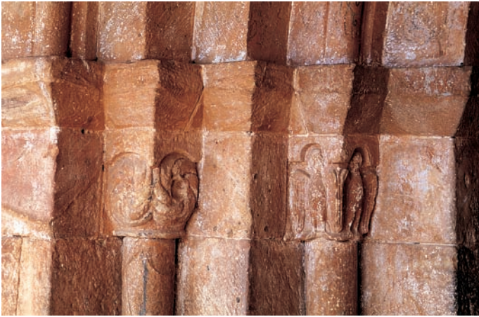
Capiteles del lado izquierdo de la portada. Molinillos vegetales y arpías