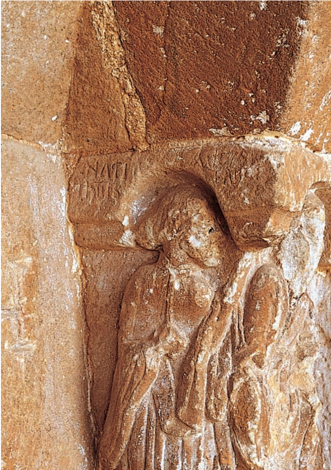
Capitel con inscripción alusiva a San Juan Bautista

Los capiteles del lado derecho se decoran con dos arpías y con hojas dispuestas en forma de hélice que recuerdan ejemplos del cercano foco aquilarense (monasterio de Santa María la Real de Aguilar de Campoo, Zorita del Páramo, Vallespinoso de Aguilar, Villanueva del Río, Santa María de Piasca, etc.), y que fueron torpemente imitados en las cercanas iglesias de Basconcillos del Tozo, Mundi-lla, Pedrosa de Valdelucio y Bañuelos de Rudrón. La datación de los capiteles palentinos en los últimos años del siglo XII y de Piasca en torno a 1172 sugiere para estos ejemplos burgaleses una cronología más tardía que debe rondar el primer tercio del siglo XIII. Esta decoración evidencia la copia de un mismo modelo por manos diferentes, aunque en todos los casos se trata de artesanos populares poco preparados para la interpretación de temas figurados.