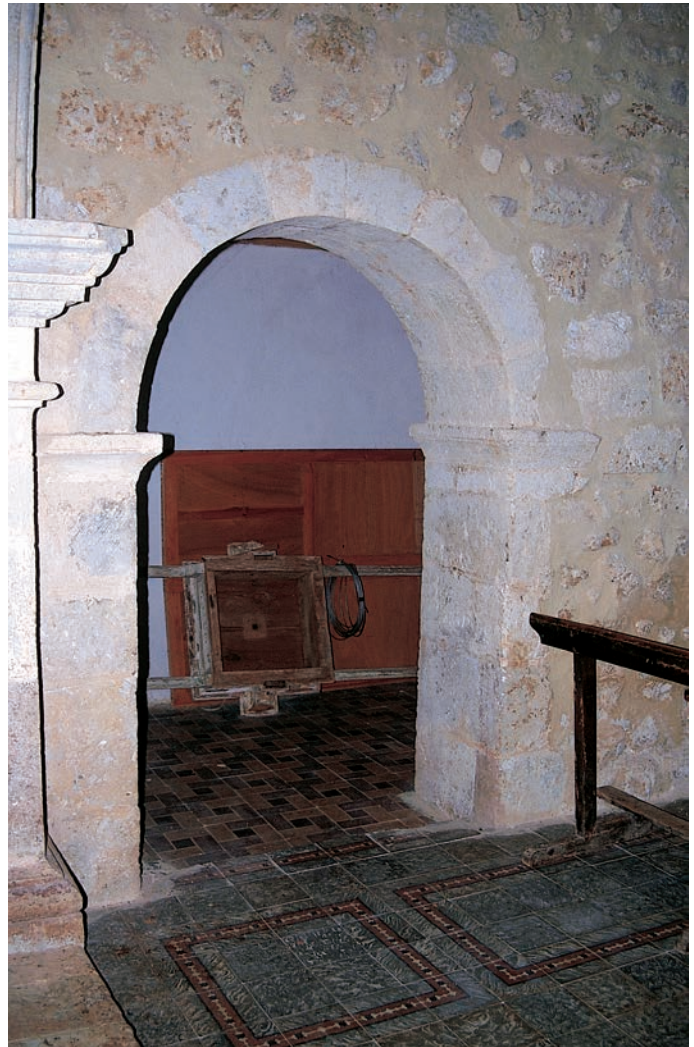
Arco de la sacristía