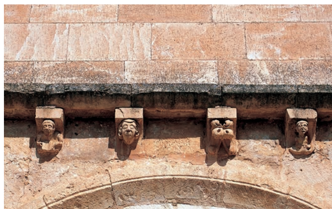
Detalle de los canecillos

La portada, que no se adelanta al muro, la configuran dos arquivoltas y la chambrana. El arco de acceso es liso, el segundo se decora con dientes de sierra bajo los que se aprecia el bocel que remata la arista y la chambrana es lisa. Apoya sobre cimacios lisos tallados a nacela que arrancan de dos jambas acodilladas, la primera con un ligero rebaje en la arista, y la segunda rematada en semicírculo, simulando una columnilla. Sobre la portada se ha conservado parte de la cornisa original, sujeta por diez canecillos. Éstos muestran los siguientes motivos: una cabeza masculina con el cabello peinado con la raya en medio y barbado; una cabeza zoomorfa de prominente boca con dos hileras de dientes; un joven de corta melena que sujeta un libro abierto entre ambas manos; un personaje imberbe de