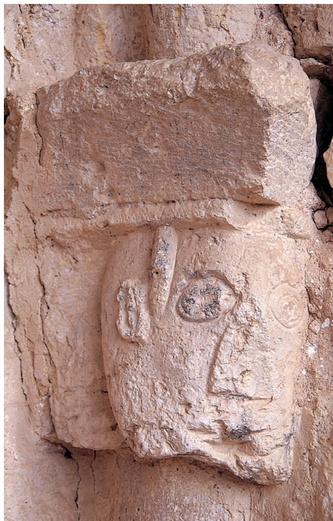
Capitel de la portada

En el lado sur se halla la antigua portada, formada por un arco de ingreso apuntado y tres arquivoltas de bocel separadas por otras más finas decoradas con un curioso motivo de semicírculos afrontados u ovas que se repite también en las parroquiales de Arenillas de Villadiego, Villusto y Fuenteúrbel. Apoyan las primeras sobre tres pares de columnas con capiteles de hojas planas rematadas en volutas y grotescos mascarones de rasgos antropomorfos. Cerrando el conjunto se dispone una chambrana de