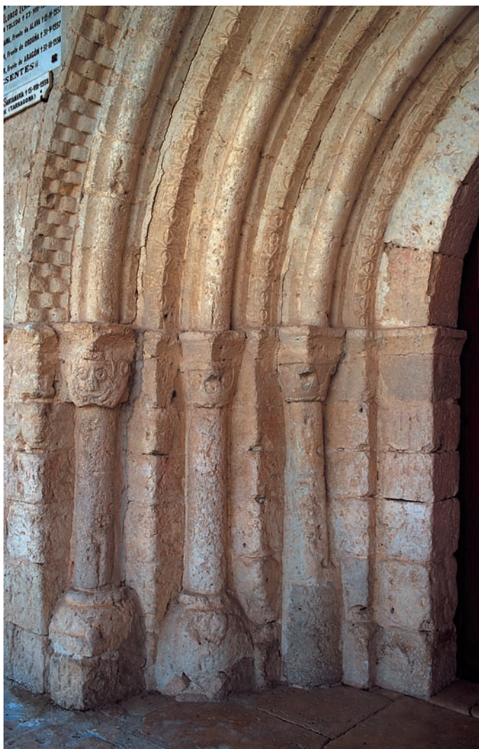
Detalle de la portada

con mampostería, quedando los antiguos canecillos muy por debajo de la cornisa actual. Posteriormente, en el siglo XVIII, se reformaron las cubiertas de los dos últimos tramos.