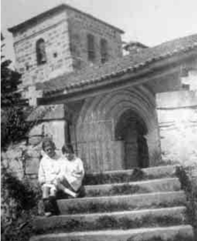
Puerta meridional de la iglesia