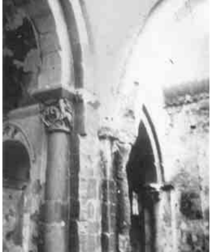
Capitel derecho y columna del arco triunfal