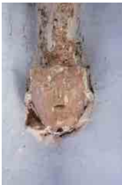
Ménsulas de las que arrancan los nervios angulares de la bóveda del ábside