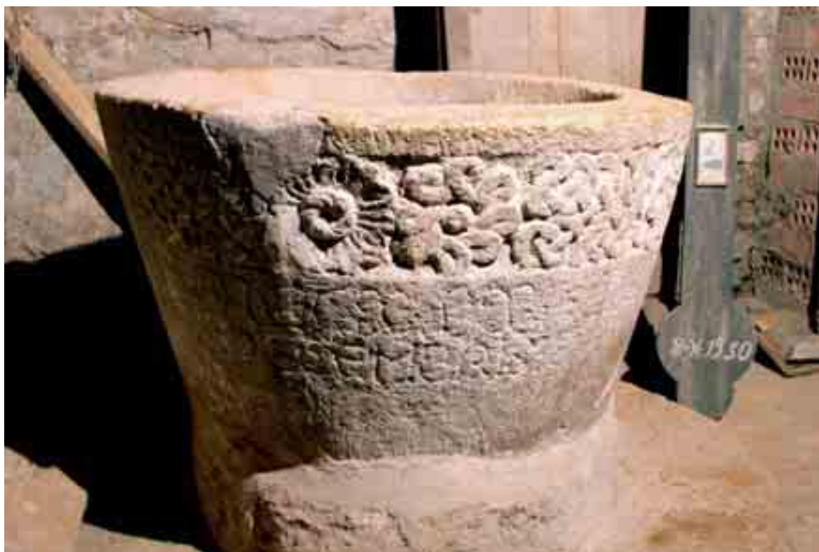
Pila bautismal, fechada en 1200