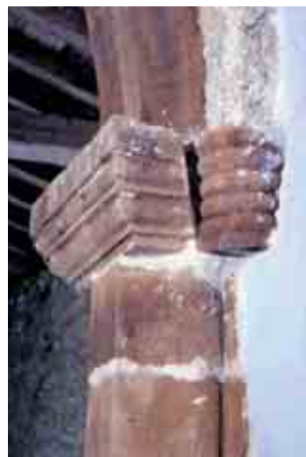
Cimacio derecho del arco triunfal y ménsula de rollos

también es rectangular con bóveda de nervios de ocho placentas y una clave central con el relieve de una cruz florenzada. Arco triunfal apuntado y doblado con aristas matadas. Apoya sobre altas pilastras poligonales que llevan cimacios multimoldurados. Las basas son rectangulares sobre plinto. Notas con recuerdos románicos de inercia son las ménsulas, desde las que arrancan los nervios angulares de la bóveda del ábside, que se tallan en forma de rostro frontal de persona, dos de ellas, y con rollos las más próximas al arco triunfal. Exteriormente, la cornisa de la cabecera se sostiene, en sus tres lados, por medio de canchillos de cuarto de bocel, así como el muro meridional de la nave también utiliza toda una serie de este tipo de canchillos. La puerta, abierta en este muro, es sencilla, de cinco grandes dovelas y una chambrana de medio punto simplemente destacada.