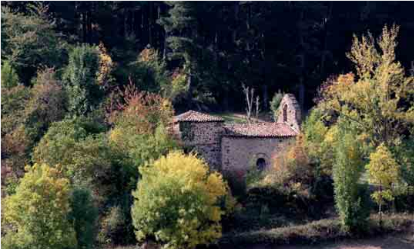
Vista exterior de la ermita de La Parte