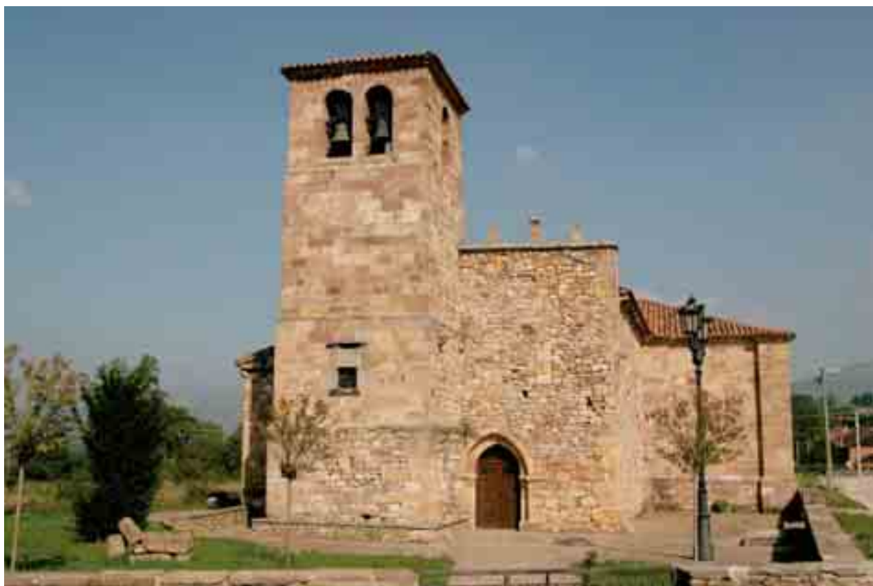
Vista de la iglesia desde el Norte