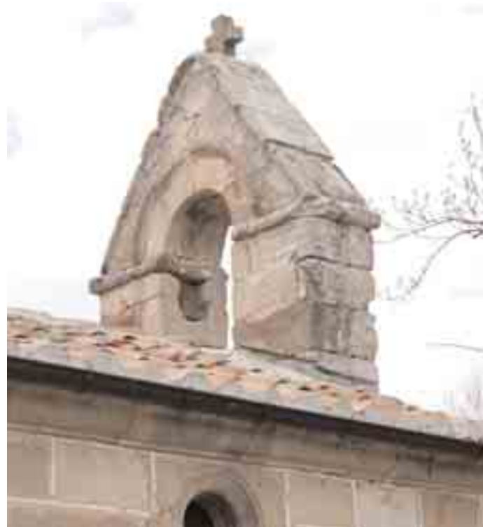
La vieja espadaña de la fábrica románica tardía

AA.VV., 1985a, GEC, VII, p. 92; AA.VV., 1996a, pp. 216-217; AA.VV., 2004c, ALCALDE CRESPO, G., 1994, pp. 95, 236; ARCE DÍEZ, P., 2006, p. 394; BERZOSA GUERRERO, J., 2005, pp. 121-122; BERZOSA GUERRERO, J., 2006, pp. 331-332; GARCÍA GUINEA, M. A., 1979a, I, pp. 104, 290; II, p. 518; GARCÍA GUINEA, M. A., 2004a, p. 233; GONZÁLEZ DE FAUVE, M a E., 1992, II, doc. 369, pp. 339-340, 365; HERBOSA, V., 2002, p. 82; MADOZ, P., 1845-1850 (1984), p. 178; MARTÍNEZ DÍEZ, G., 1981, I, p. 491; VIGO, S., EYNDE, E. van den y RINCÓN, R., 2002, p. 386.