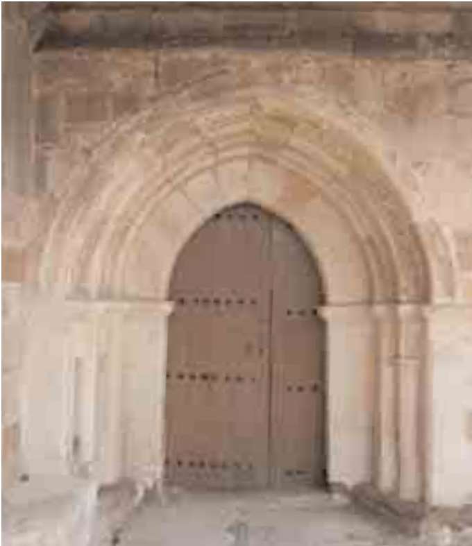
Detalle de la puerta de su primitiva iglesia románica