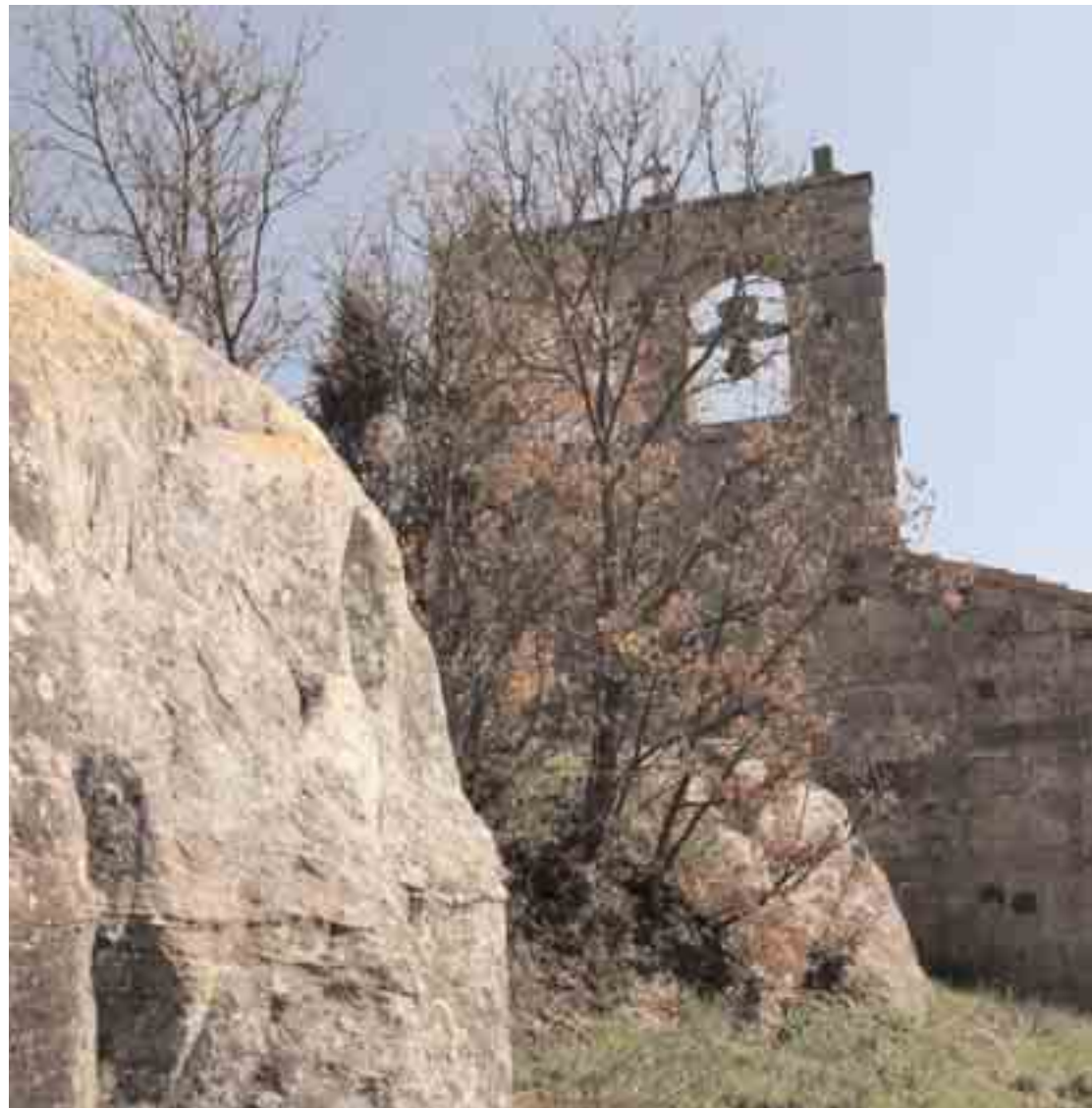
La iglesia de San Vicente Mártir y su entorno

Consta documentalmente Rebollar, como el lugar de procedencia de uno de los testigos que figuran en documentos, fechados en 1231, del Cartulario del Monasterio de Santa María de Aguilar de Campoo, con motivo de venta de solares en distintos lugares de Valderredible al citado monasterio (GONZÁLEZ DE FAUVE, 1992). En el Becerro de las Bebetrias (1352), se registra el lugar de "Entre Puerta", en nota a pie de página Martínez Díez (1981) apunta: "Entrepuerta. Despoblado en el término municipal de Rebollar, a 500 m al Sur de este lugar, a la izquierda del arroyo Zarrillo y a la derecha del río Ebro, lindando con ambos ríos en la desembocadura del primero de ellos en el segundo. Existe todavía una ermita y algunas casas". Era solariego; Lope Díaz de Rojas tenía dos vasallos, el Monasterio de San Martín de Elines un vasallo, y Martín Alfonso de Arniellas otro vasallo.