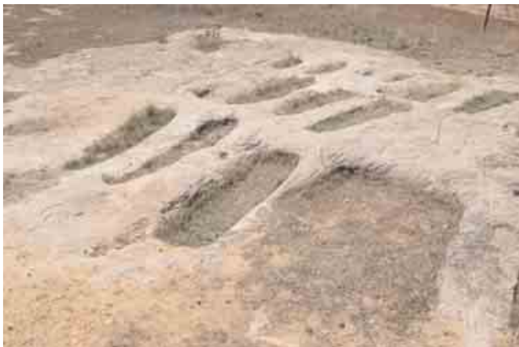
Sepulturas rupestres de la necrópolis que ocupaba la misma roca donde se excavó la iglesia

el tipo de tumbas que suelen acompañar a los poblamientos que en estos siglos había en la zona. Recientemente, se ha inaugurado, en construcción aparte, un Centro de Interpretación dedicado a explicar la historia de los conjuntos rupestres de Valderredible.