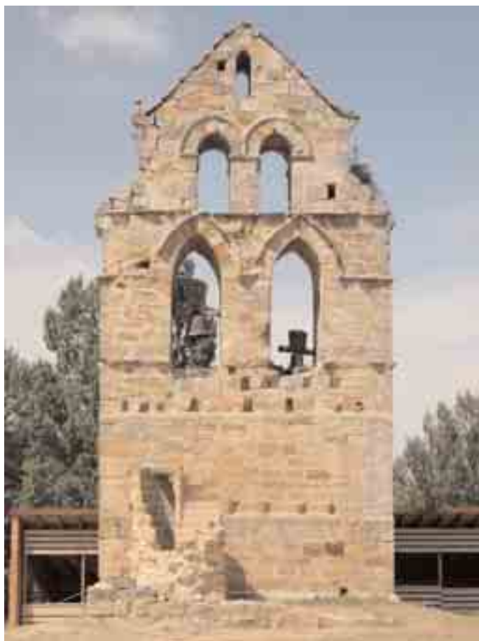
Aspecto de la espadaña románica, con restos de la escalera que tuvo el campanario