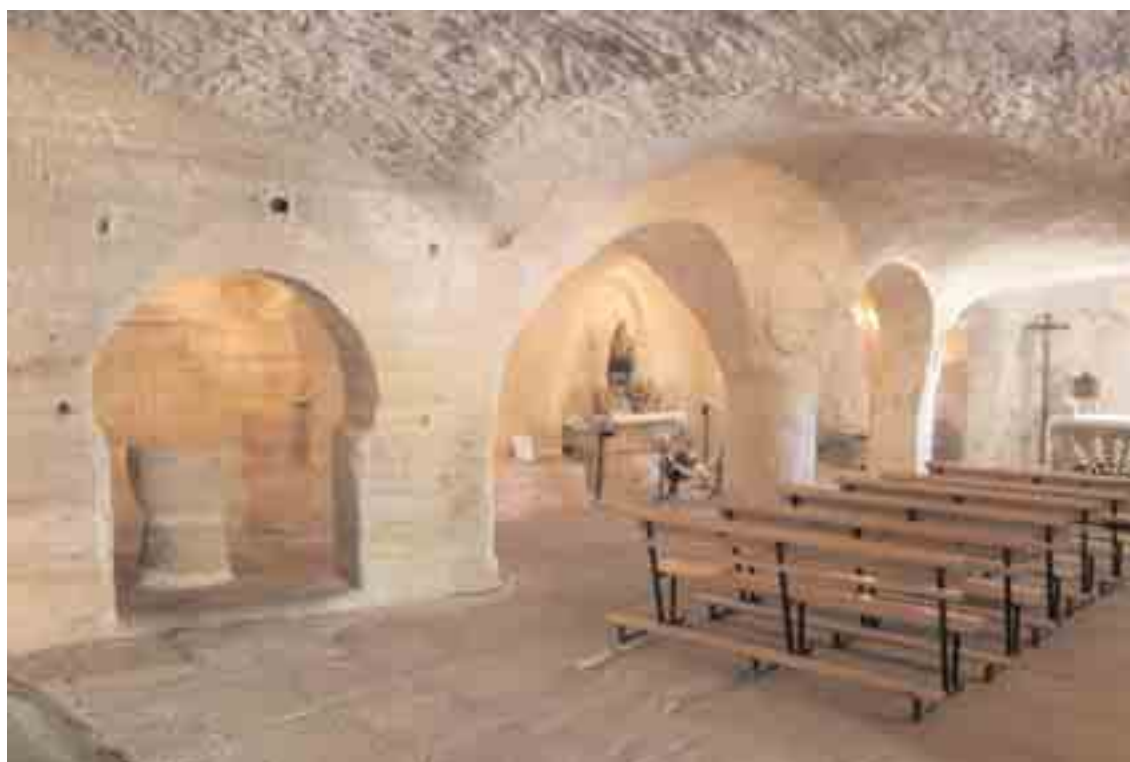
Aspecto del interior de la iglesia rupestre. Lo más antiguo sería la nave donde ahora está la pila, orientación al Este.