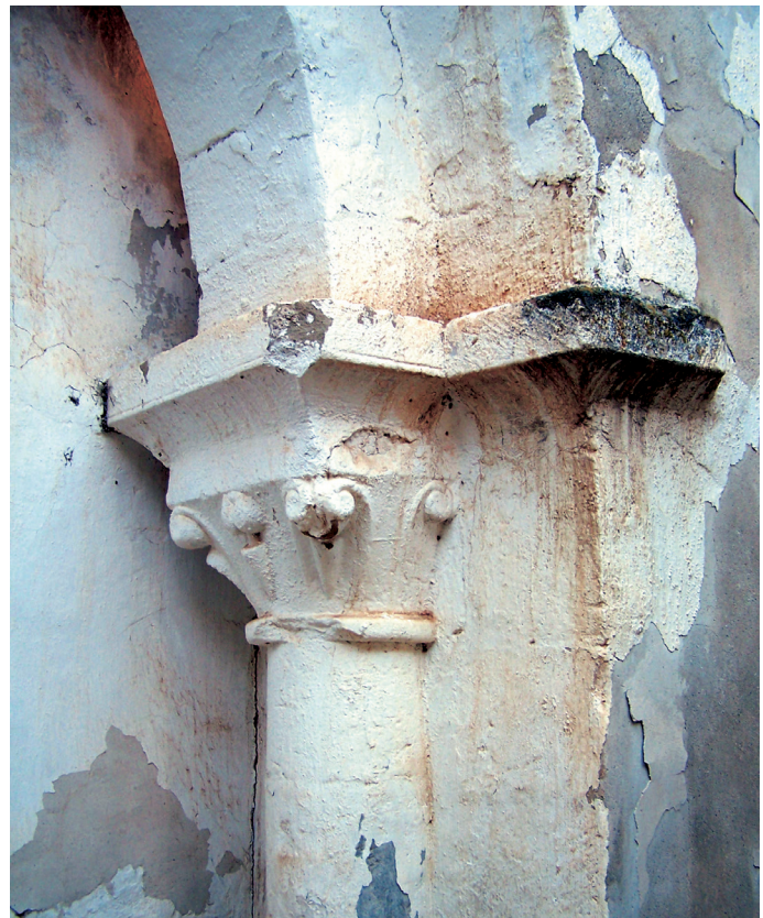
Capitel del arco triunfal

COMISIÓN DIOCESANA DEL PATRIMONIO, 1982, pp. 193-194; ESPOILLE DE ROIZ, M. E., 1982, pp. 206-227; GONZÁLEZ GONZÁLEZ, J., 1982, pp. 183-188; LARRAÑAGA MENDÍA, J., 1990, p. 385; MADDOZ, P., 1845-1850 (1987), I, p. 277; MONEDERO BERMEJO, M. A., 1982, p. 77; NIETO TABERNÉ, T., ALEGRE CARVAJAL, E. y EMBID GARCÍA, M. A., 1994, pp. 209-214; NIETO TABERNÉ, T. y ALEGRE CARVAJAL, E., 2001, pp. 68-69; SAIZ, S. y MARTÍNEZ, A., (coord.), 1987, I, pp. 80-81.