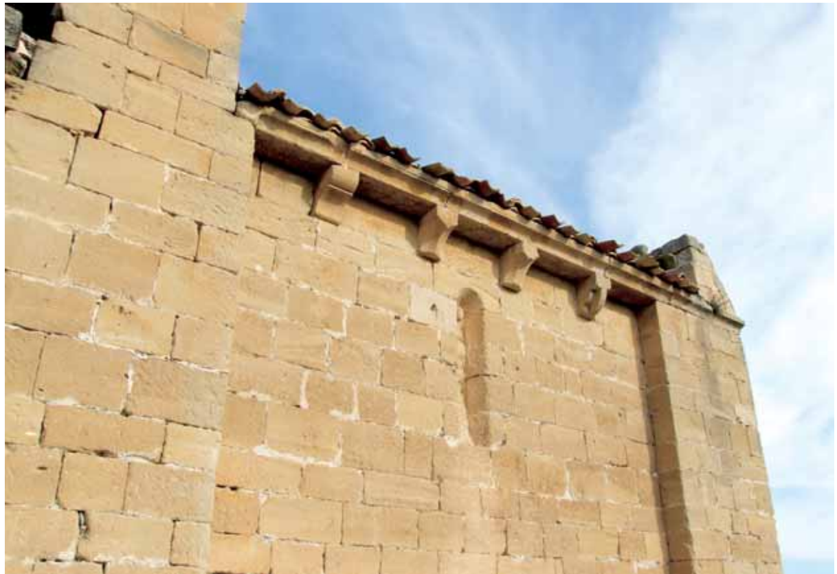
Ventana y canecillos