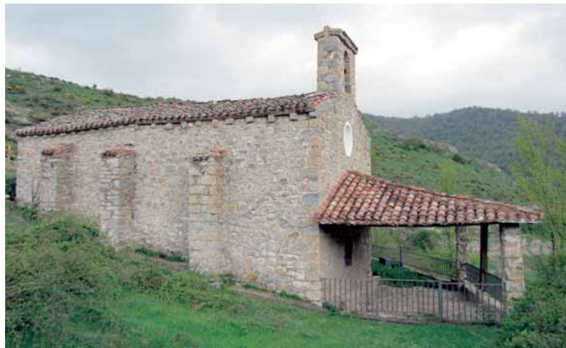
Exterior desde el Norte

y la cabecera rectangular están cubiertas con cañón apuntado. Tanto la cabecera como la nave están divididas en dos tramos por dos arcos fajones que apoyan en ménsulas.