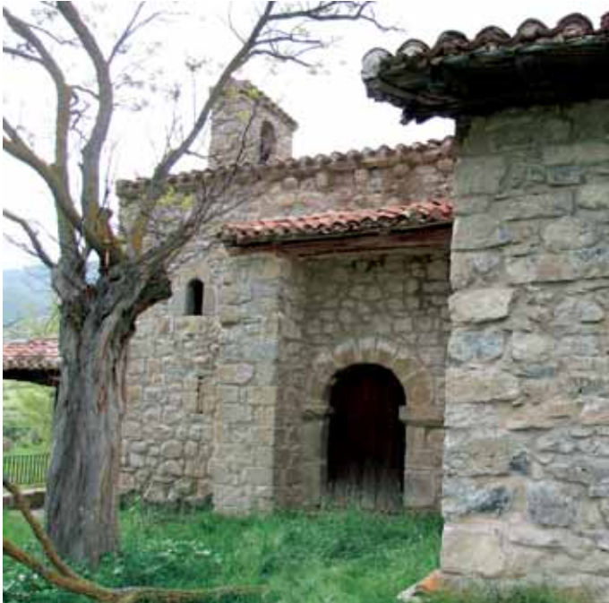
Fachada sur y portada