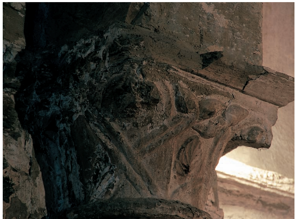
Capitel del arco triunfal