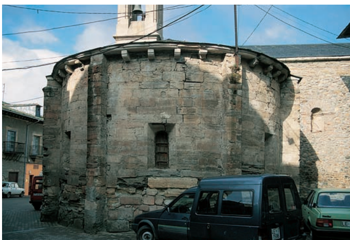
Exterior del ábside

La construcción de dicho ábside se realizó en sillarejo de pizarra reforzado en algunos puntos con sillería del mismo material. En el exterior, dos contrafuertes prismáticos de aristas achaflanadas que llegan hasta la cornisa compartimentan el tramo curvo en tres paños perforados cada uno de ellos por un ventanal rectangular abocinado de factura más moderna. Otros dos contrafuertes más gruesos