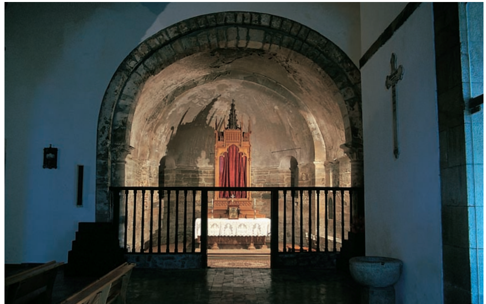
Interior del ábside