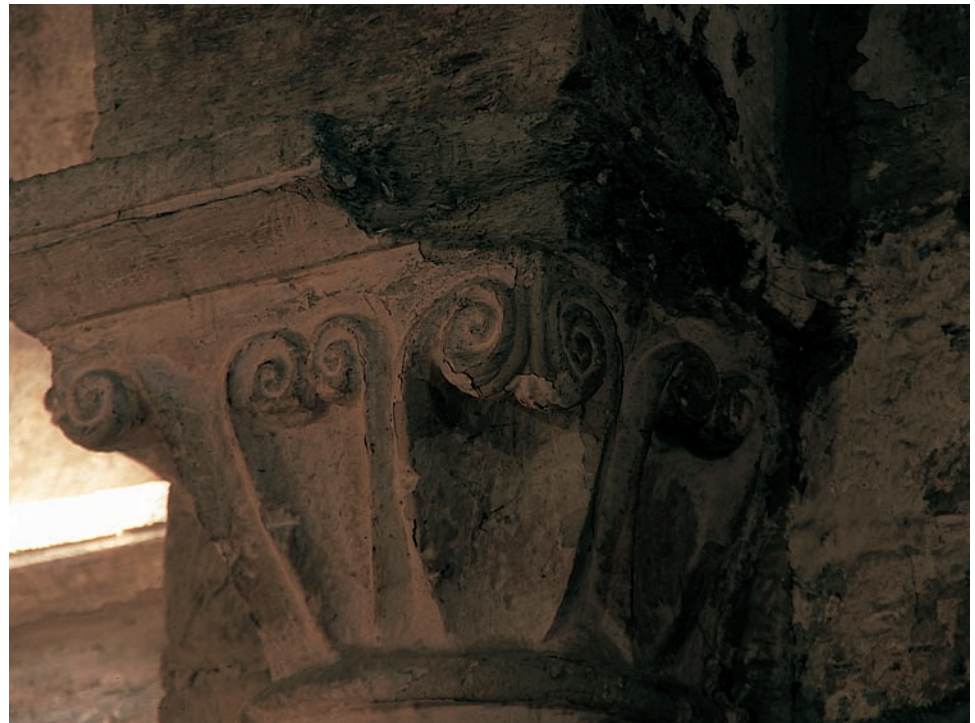
Capitel del arco triunfal