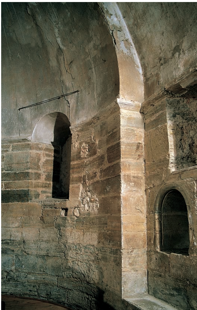
Detalle del ábside

separan este tramo del presbiterio. La cornisa que remata el muro está muy restaurada, observándose algunas piezas originales de perfil biselado soportadas por canecillos de traza muy simple, lisos o con uno o dos rollos.